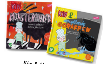
Kivi & Monsterhund Kivi & den gråtande goraffen