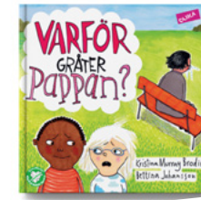
Varför gråter pappan?

Titel av samma författare och illustratör: