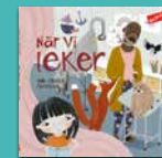
När vi leker