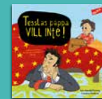
Tesslas pappa vill inte!