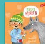
Zozo och hunden