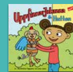
UppfinnarJohanna och Huttan