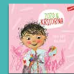
Zozo och kritorna