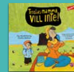
Tesslas mamma vill inte!