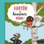
Varför är brorsan rädd?