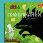
Kivi och Drakbrakaren