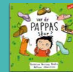
Var är pappas skor?