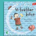
Vi tvättar bilen