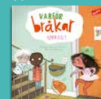
Varför bråkar syrran?