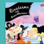
Piraterna och förtrollningen