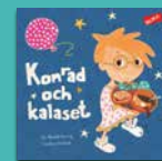
Konrad och kalaset