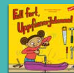
Full fart, UppfinnarJohanna!