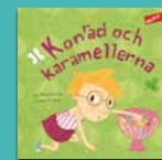
Konrad och karamellerna