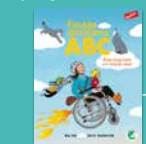
Fyndiga uttrycks ABC