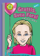
Grattis, Svea Fors!