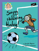
Snygg räddning, Hedvig!