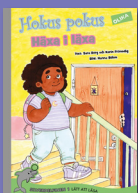
Hokus pokus: Häxa i läxa