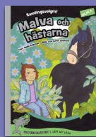
Malva och hästarna