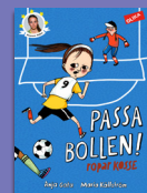
Passa bollen! ropar Kosse