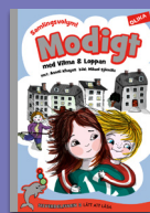
Modigt med Vilma & Loppan