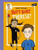
Rött kort, Therese!