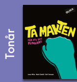
Ta makten – för att det funkar!