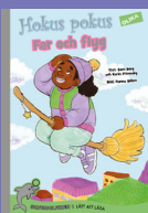
Hokus pokus: Far och flyg