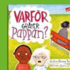
Varför gråter pappan?