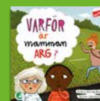
Varför är mamman arg?