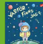
Varför finns jag?