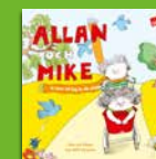
Vi leker att jag är din pappa