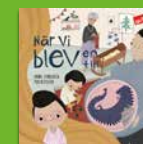
När vi blev en till