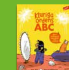
Kluriga ordens ABC