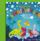
Stjärnfall i dinosaurieland