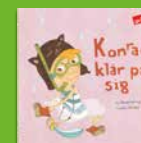
Konrad klär på sig