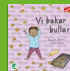
Vi bakar bullar