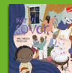
När vi sover