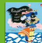
Piraterna och vinterjakten