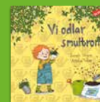
Vi odlar smultron