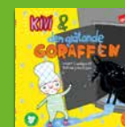
Kivi och goraffen