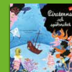
Piraterna och spökraket