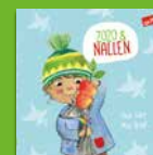
Zozo och nallen