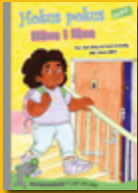
Hokus pokus: Häxa i läxa