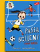
Passa bollen! ropar Kosse