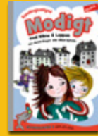
Modigt med Vilma & Loppa