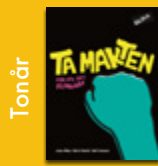
Ta makten – för att det funkar!

Ladda ner BOKHANDLEDNINGAR kostnadsfritt på olika.nu