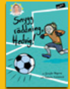
Snygg räddning, Hedvig!