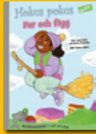
Hokus pokus: Far och flyg