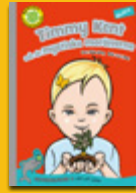
Timmy Kent och de mystiska morötterna