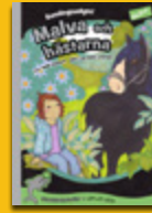
Malva och hästarna