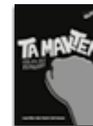
Ta makten – för att det funkar!

Ladda ner BOKHANDLEDNINGAR kostnadsfritt på olika.nu