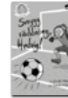
Snygg räddning, Hedvig!