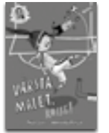
Värsta målet, Kosse!