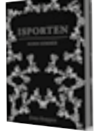
Isporten: Elden kommer