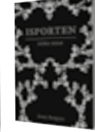
Isporten: Andra sidan