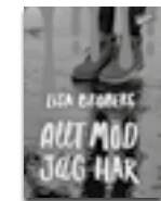
Allt mod jag har