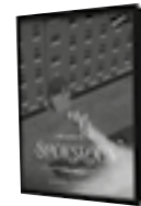
Spionen på Spöskolan