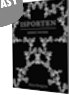
Isporten: Mörkt vatten