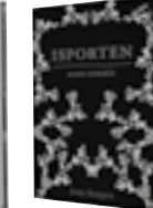
Isporten: Elden kommer