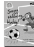
Snygg räddning, Hedvig!