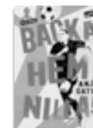
Backa hem, Nilla!