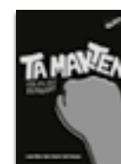
Ta makten – för att det funkar!

Ladda ner BOKHANDLEDNINGAR kostnadsfritt på olika.nu Fördjupa läsningen och ställ normkreativa frågor.