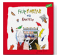
Filip, morfar och kärleken