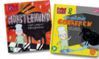
Kivi & Monsterhund Kivi & den gråtande goraffen