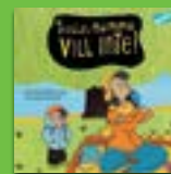
Tesslas mamma vill inte!