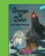
Gunga åt Öster