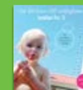
Ge ditt barn 100 möjligheter Istället för 2