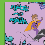
Hjärte med hjärta