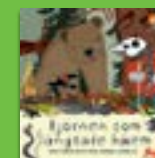
Björnen som längtade hem