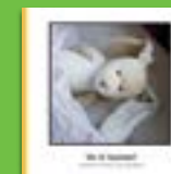
Var är kaninen?