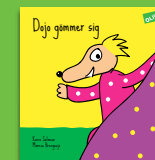
Dojo gömmer sig