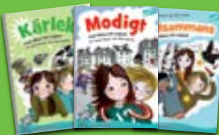
Vilma och Loppan