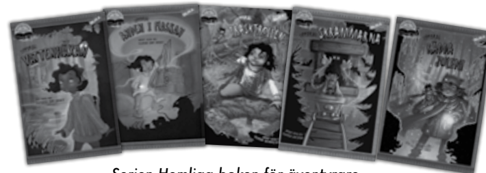
Serien Hemliga boken för äventyrare