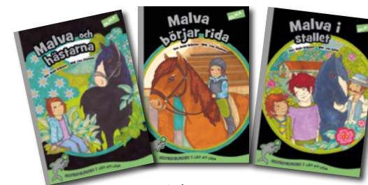
Malva-serien Silverdelfinen 1