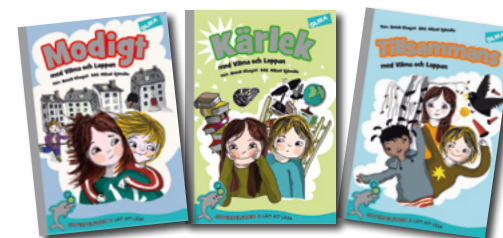
Vilma och Loppan-serien Silverdelfinen 2