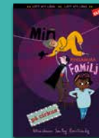
Min pinsamma familj på cirkus