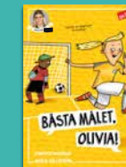
Bästa målet, Olivia!