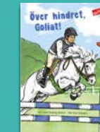
Över hindret, Goliat!