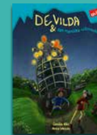
De vilda och den mystiska tidsmaskinen