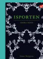
Isporten Andra sidan