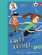
Rakt i krysset, Kosse