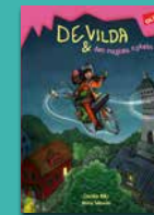
De vilda och den magiska cykeln