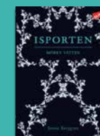
Isporten Mörkt vatten