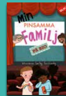
Min pinsamma familj på bio