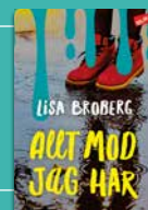
Allt mod jag har