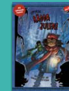
Uppdrag: Rädda julen