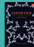
Isporten Elden kommer