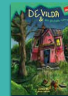
De vilda och den gåtfulla tjuven