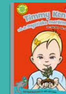
Timmy Kent och de mystiska morötterna