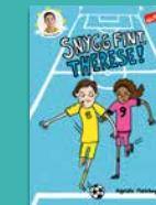
Snygg fint, Therese!