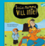
Tesslas mamma vill inte!