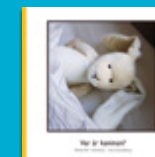
Var är kaninen?