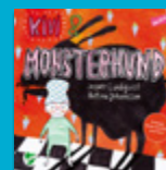
Kivi & Monsterhund