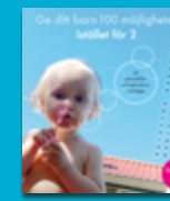
Ge ditt barn 100 möjligheter Istället för 2