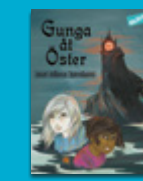
Gunga åt Öster