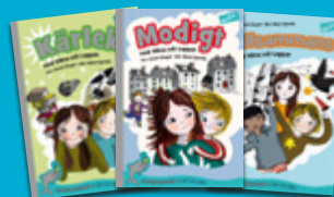
Vilma och Loppan