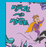
Hjälte med hjärta