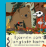
Björnen som längtade hem