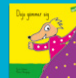
Dojo gömmer sig