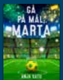
Gå på mål, Marta