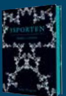
Isporten: Mörkt vatten