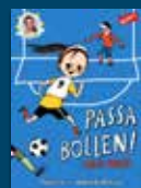
Passa bollen! ropar Kosse