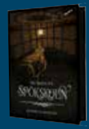
Mumien på Spöskolan