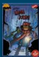
Uppdrag: Rädda julen