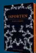
Isporten: Elden kommer