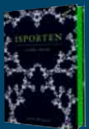
Isporten: Andra sidan