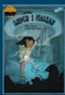
Uppdrag: Anden i flaskan