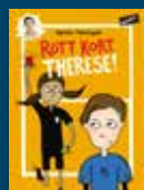
Rött kort, Therese!