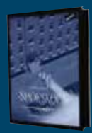
Spionen på Spöskolan