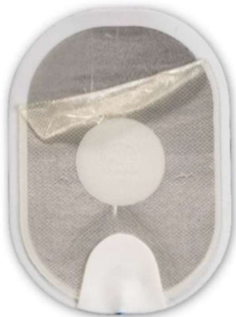
Afbeelding 1: losgelaten gel die op zichzelf is gevouwen na het verwijderen van de bescherm laag.

Het is ook mogelijk dat de gel bijna volledig van de schuimlaag/folie-achterkant loslaat tijdens het verwijderen van de bescherm laag (zie afbeelding 3 .) Als gevolg van een klein contactgebied van het geloppervlak met de huid, kan een elektrische vonk ontstaan wanneer een schok wordt toegediend. Dit kan leiden tot brandwonden op de huid van de patiënt of de AED is niet in staat om een schok toe te dienen via de elektroden. Er zal een vertraging in de therapie optreden wanneer de gebruiker een vervangende elektrodecassette installeert (indien beschikbaar) of reanimatie uitvoert terwijl hij wacht tot de medische hulpdiensten arriveren. Ter vergelijking: afbeelding 4 toont een normale elektrode. Volg de gesproken instructies op, ongeacht de toestand van de elektrode, omdat de AED u door de noodzakelijke handelingen zal leiden.