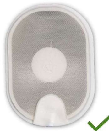
Afbeelding 4: normale elektrode.