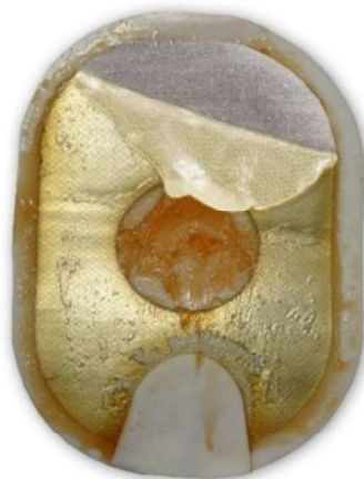
Afbeelding 2: losgelaten, omgevouwen gel kan er ook verkleurd en/of gesmolten uitzien.

Actie: Brenge de elektroden aan op de patiënt. Aarzel niet.