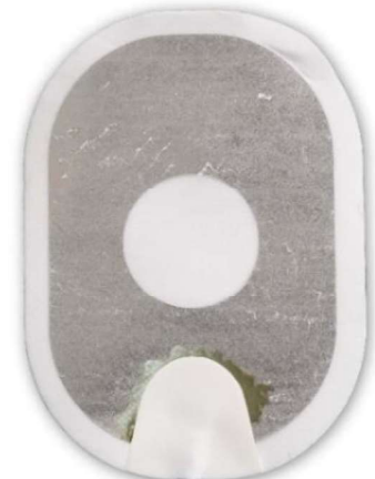
Afbeelding 3: de gel heeft bijna volledig losgelaten van de achterkant.

Actie: Brenge de elektroden aan op de patiënt. Aarzel niet.