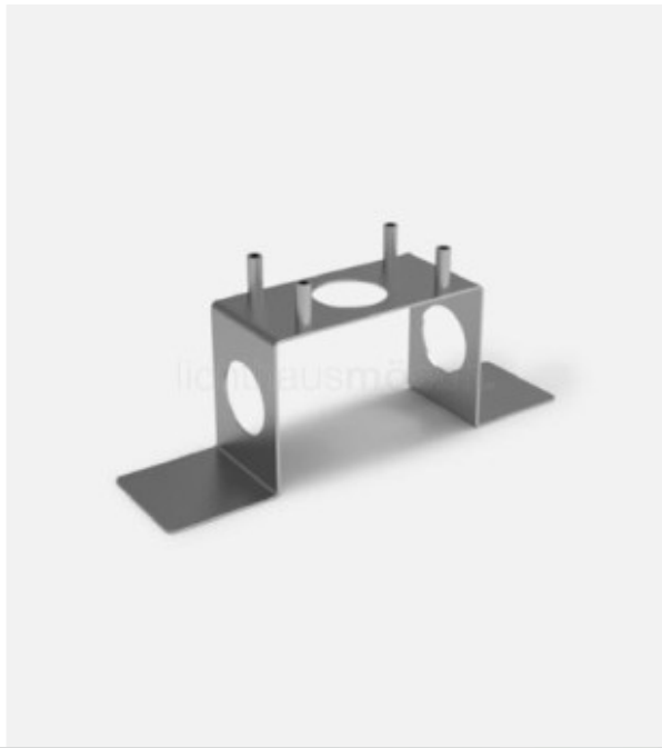
Fixing plate measures