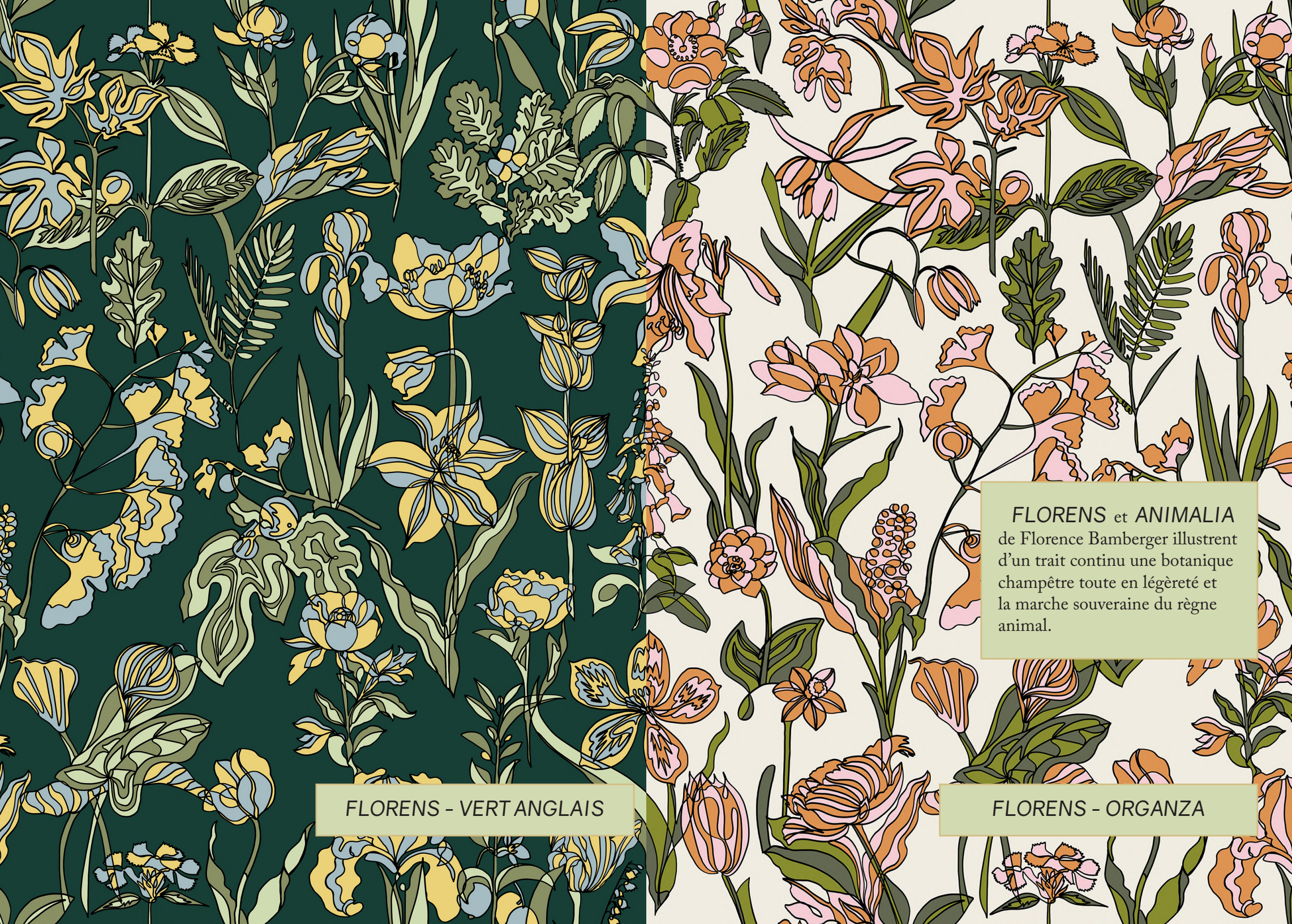
FLORENS - VERT ANGLAIS

FLORENS et ANIMALIA de Florence Bamberger illustrent d'un trait continu une botanique champêtre toute en légèreté et la marche souveraine du règne animal.