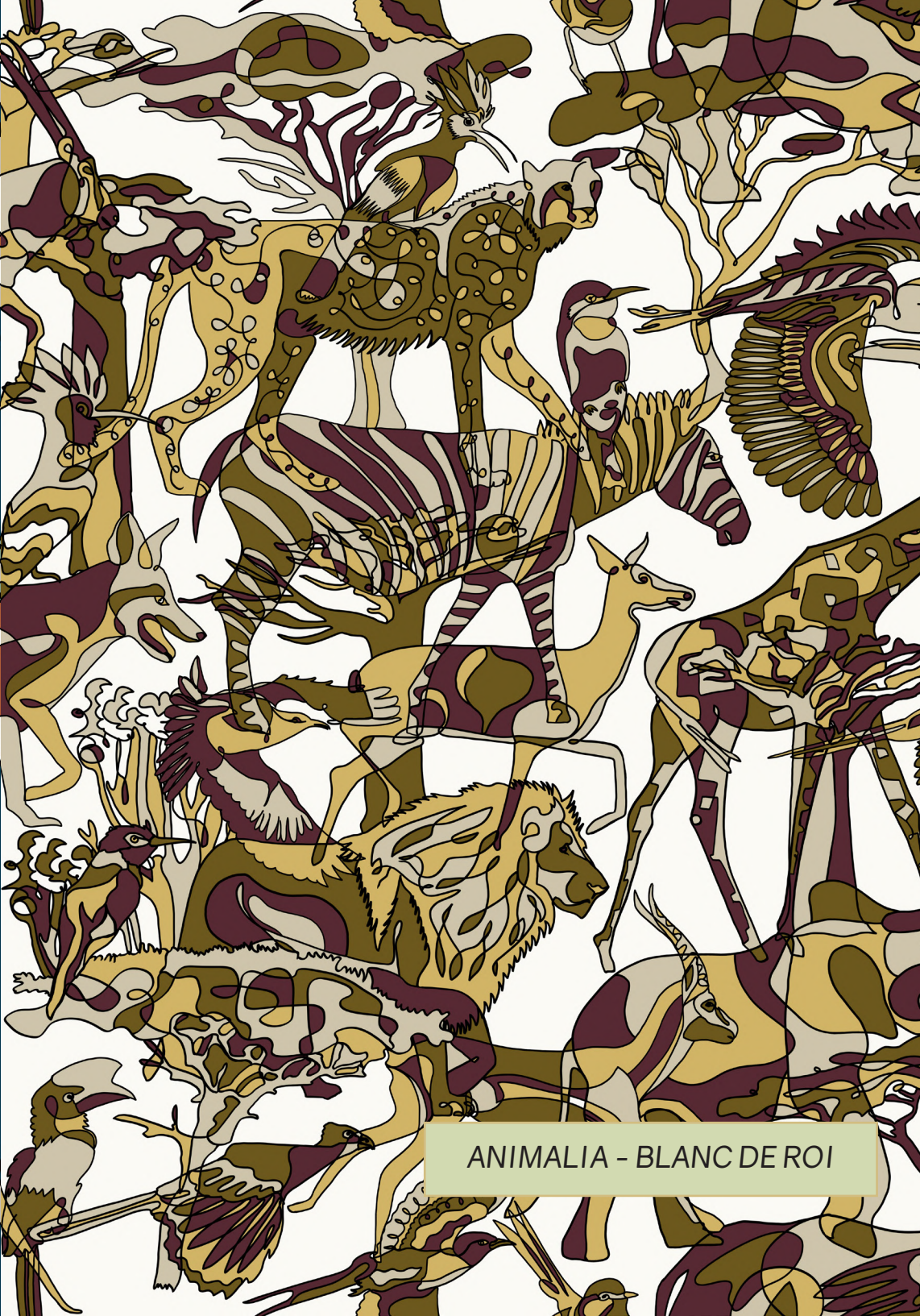
ANIMALIA - BLANC DE ROI