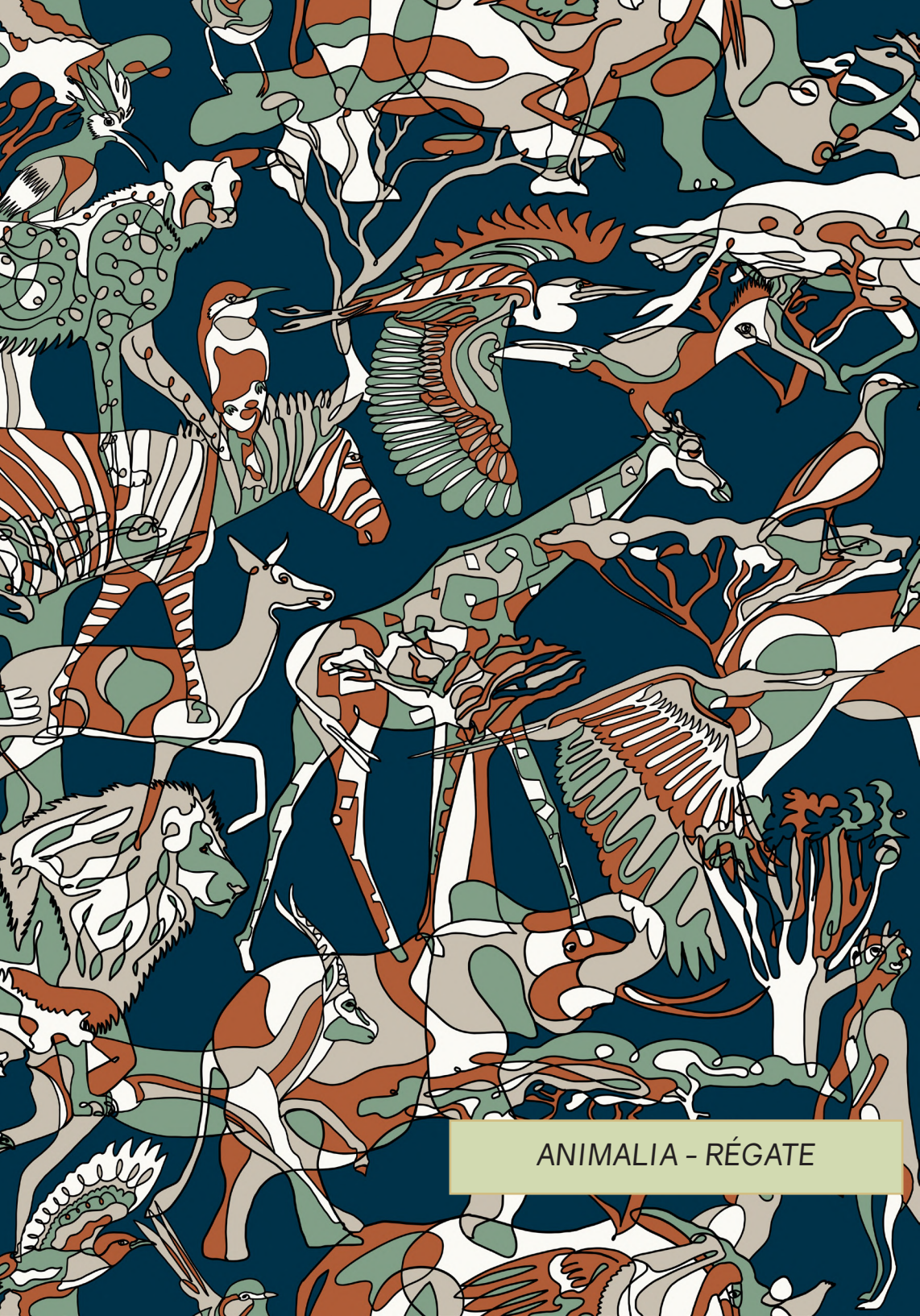
ANIMALIA - RÉGATE