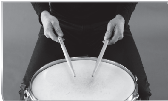
1.2 Matched Grip – French