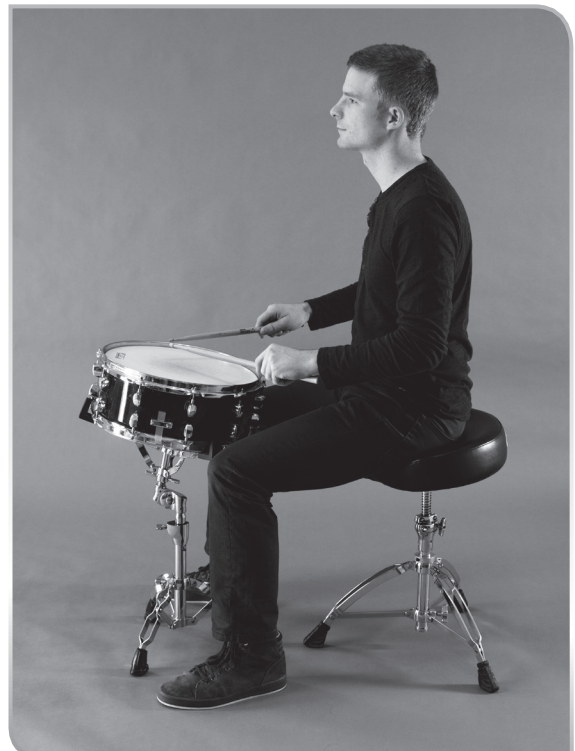
1.7 Die richtige Haltung