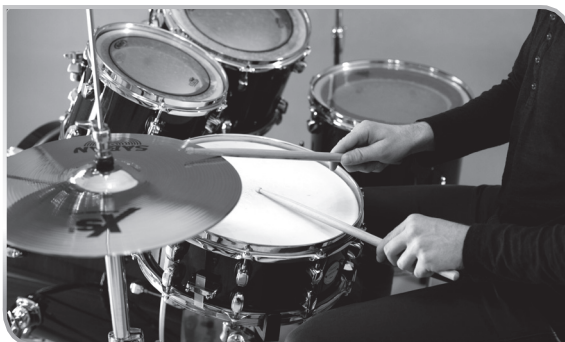
1.6 Die richtige Haltung