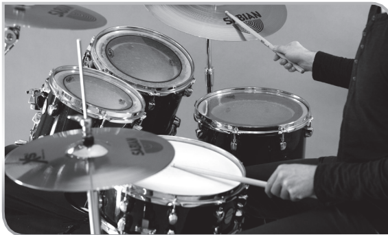
1.5 Die richtige Haltung

Aber wie nah am Schlagzeug sitzt man am besten? Leg die Stockspitzen in die Mitte der Snaredrum und sitz aufrecht. Wo sind deine Ellenbogen? Sie sollten in dieser Position locker an deiner Seite hängen. Du wirst überrascht sein, wie weit entfernt vom Schlagzeug dies ist. Aber keine Sorge, du wirst immer noch alle Teile des Drumsets gut erreichen können.