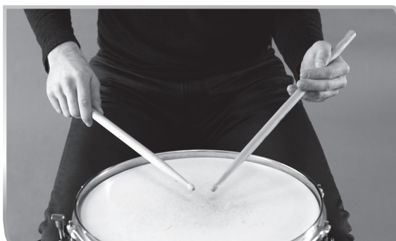
1.4 Traditional Grip