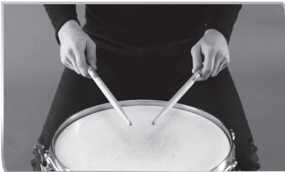
1.1 Matched Grip – American

Bisher hast du die Stöcke wahrscheinlich ganz natürlich gehalten, wie es sich gut anfühlt. Und das ist auch das wichtigste. Die richtige Haltung der Sticks kann dein Spiel noch weiter nach vorne bringen, weil du mit mehr Kontrolle noch genauer und noch schneller spielen kannst. Hier sind die vier verbreitetsten Arten, die Stöcke zu halten: