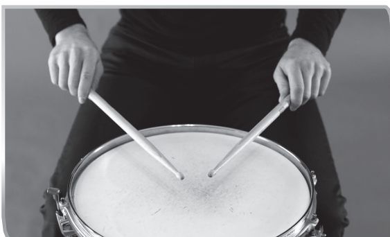
1.3 Matched Grip – German