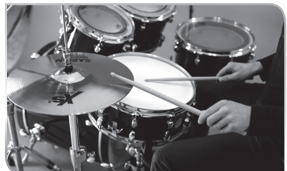
1.8 Die richtige Haltung – Open Style

Für Linkshänder gibt es mehrere Optionen: Natürlich kannst du genauso spielen wie Rechtshänder, dann musst du gar nichts anders machen. Du kannst aber auch das Schlagzeug genau spiegelverkehrt aufbauen.