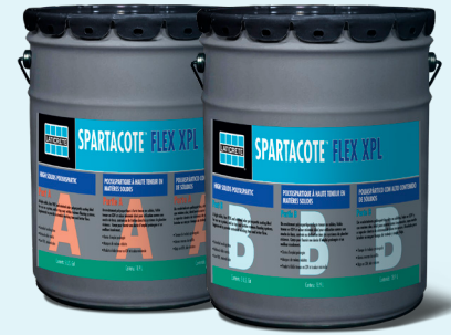
Data Sheet DS-32830.0

SPARTACOTE™ FLEX XPL™ is a high solids, low VOC resinous floor coating for both decorative and protective applications. This high performance coating has been engineered to retain a lower viscosity for longer periods of time, extending its working time and offering improved flow. SPARTACOTE FLEX XPL works with the following SPARTACOTE coating systems: Chip, Quartz, Metallic and Guard.