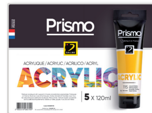
Set 5 couleurs 120ml. Code 439200100