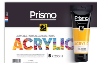
Set 5 couleurs 200ml. Code 439300100