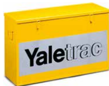
Optional: Yaletrac Seilzugbox aus Stahlblech ca. 74x26x45 cm