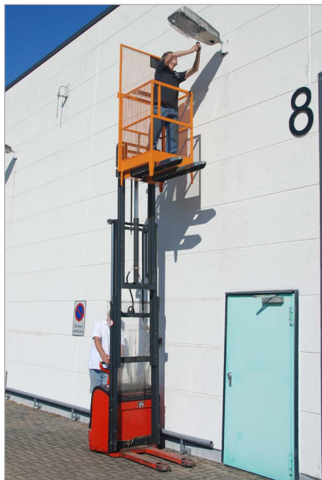
MB-I am Deichselstapler