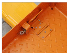
Sicherung am Deichselstapler