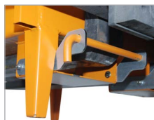
Bolzensicherung am Gabelstapler