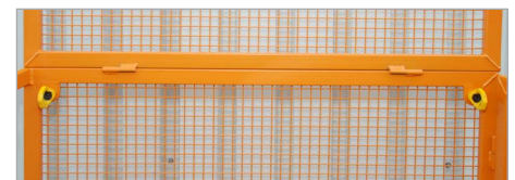
Anschlagpunkte für PSA (Persönliche Schutzausrüstung)