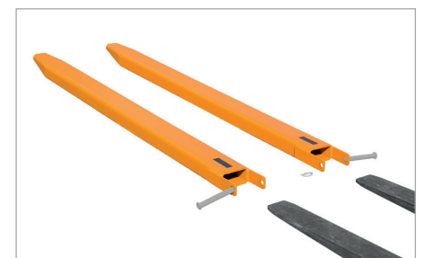
Sicherung durch Steckbolzen

Andere Abmessungen auf Anfrage lieferbar