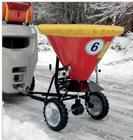
STW 100 mit Abdeckplane