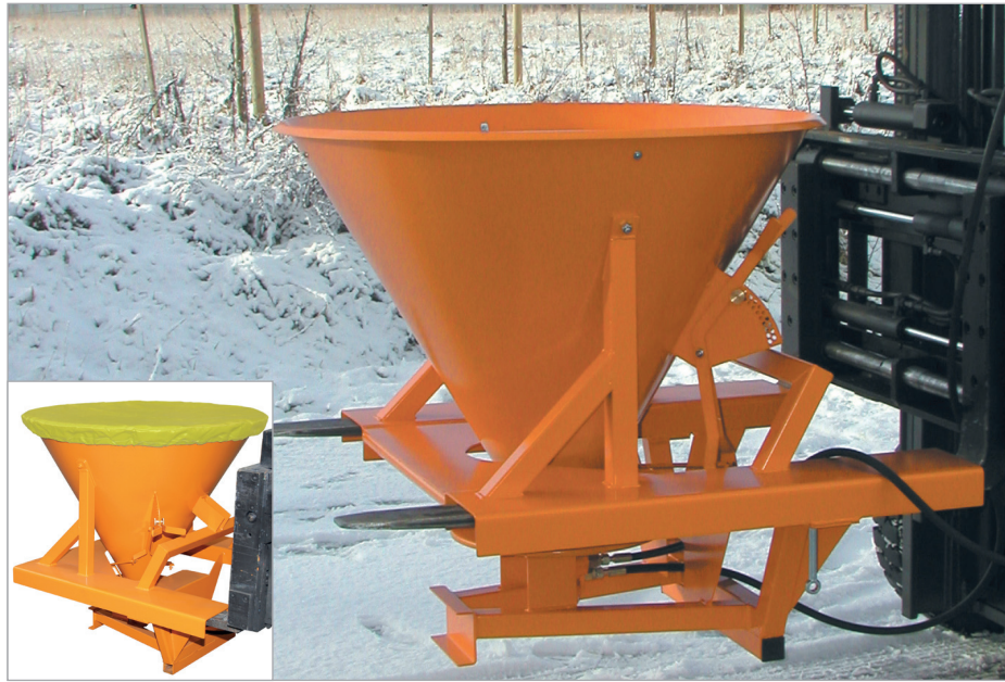
SH mit Abdeckplane