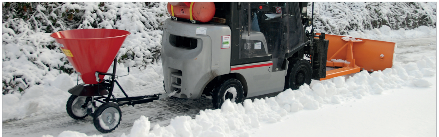
Schneeschieber SCH-G in Kombination mit STW 100