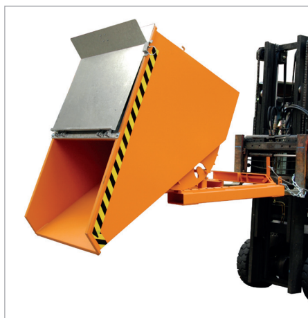
EXPO mit Deckel