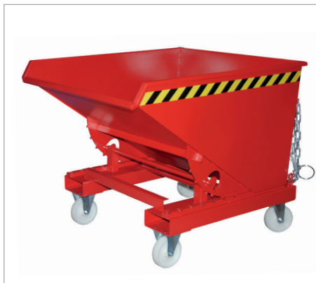
EXPO mit Rollen