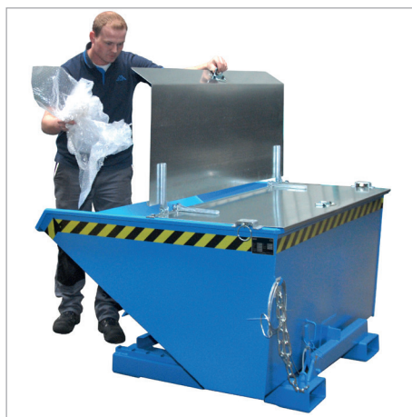
EXPO mit Deckel