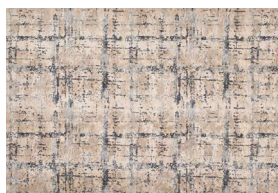
ALICE T 302