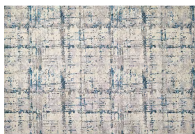
ALICE T 301