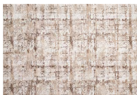
ALICE T 303

Tappeto tessuto in polipropilene e poliestere.