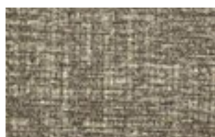
ARISA T 203