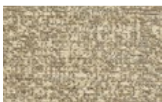
ARISA T 201