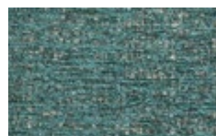
ARISA T 204