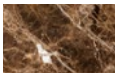
M03 - Emperador lucido/ Glossy Emperador