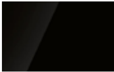
CR1 - Cristallo verniciato Nero lucido/Glossy Black painted glass