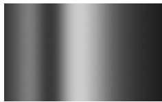
CRN - Cromo Nero/ Black Chrome