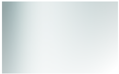
CR0 - Cristallo extrachiaro trasparente/Extra clear transparent glass

I cristalli utilizzati da EFORMA vengono temprati come richiedono e prescrivono le norme antinfortunistiche. Le lastre di vetro colorato, soprattutto nelle superfici più ampie, possono presentare dei piccoli puntini che sono dovuti alle caratteristiche di lavorazione, ai processi di verniciatura ad alte temperature ed a reazioni naturali del cristallo. Tali irregolarità non possono in alcun modo essere considerati difetti ma naturali variazioni in un processo di lavorazione molto sofisticato e delicato. / The glasses used by EFORMA are tempered as required and prescribed by accident prevention regulations. The sheets of colored glass, especially in larger surfaces, may have small dots that are due to the characteristics of its processing, of the painting process at high temperature and the natural reactions of the crystal. These irregularities can in no way be considered defects but natural variations in a very sophisticated and delicate process.