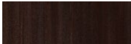
FTM - Frassino tinto Testa di Moro/ Dark Brown stained Ash