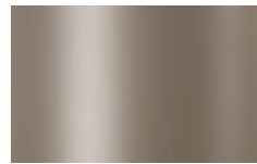
V04 - Titanio/Titanium