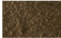
R15 - Cristallo martellato Bronzo lucido/Glossy Bronze hammered glass