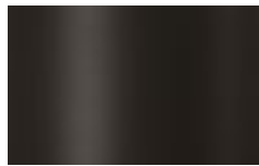
V03 - Antracite/Anthracite