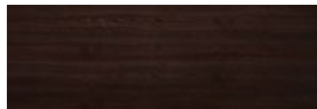
FTM - Frassino tinto Testa di Moro/ Dark Brown stained Ash