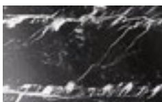
M02 - Nero Marquinia lucido/ Glossy Nero Marquinia