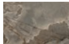
CM4 - Alabastro lucido/ Glossy Alabastro