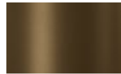
V05 - Bronzo/Bronze