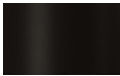
V01 - Nero/Black

I metalli della nostra collezione vengono verniciati a polvere così da rivestire le nostre superfici a scopo decorativo e protettivo. Lo spessore finale della verniciatura a polveri, risulta particolarmente elevata contribuendo ad una serie di rilevanti vantaggi sul prodotto verniciato: resistenza meccanica, resistenza agli agenti corrosivi, scarsa infiammabilità, precisione nell'applicazione. Le verniciature a polveri utilizzate sono totalmente atossiche e prive di solventi, per questo motivo la verniciatura a polveri è una lavorazione ECO-FRIENDLY, a bassissimo impatto ambientale. Disponibile la versione cromata dove il metallo o l'alluminio vengono rivestiti di cromo, conferendogli così durezza, resistenza chimica e resistenza all'ossidazione. / The metals in our collection are powder coated in order to coat our surfaces for decorative and protective purposes. The final thickness of the powder coating is particularly high contributing to a series of advantages for the painted product: mechanical resistance, resistance to corrosive agents, low flammability, precision in the application. The powder coatings used are non-toxic and solvent-free, for this reason powder coating is an ECO-FRIENDLY process, with a very low environmental impact. The chrome version is available where the metal or aluminum is coated with chrome, giving it hardness, chemical resistance and resistance to oxidation.