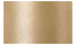
VS6 - Oro spazzolato/ Brushed Gold