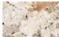
CM10 - Patagonia lucido/ Glossy Patagonia