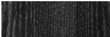
FNR - Frassino tinto Nero/Black stained Ash