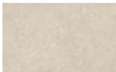
CM8 - Avorio/Avorio