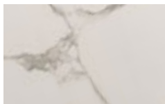
CM2 - Statuario lucido/ Glossy Statuario