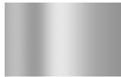
ASP - Alluminio Spazzolato/ Polished Aluminium