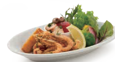
Gusto di MARE 海の幸を使った「マーレ」 ¥1,680