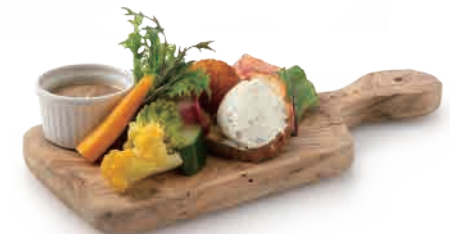
Gusto di MONTAGNA 大地の恵みを楽しむ「モンターニャ」 ¥1,680