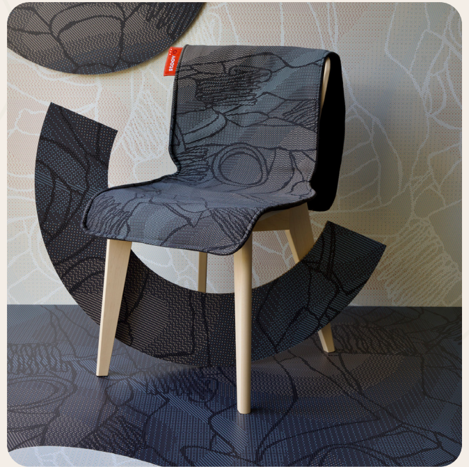
Big Hug XL Farben: Fragment Blau & Fragment Beige Maße // Preis: € 189,95