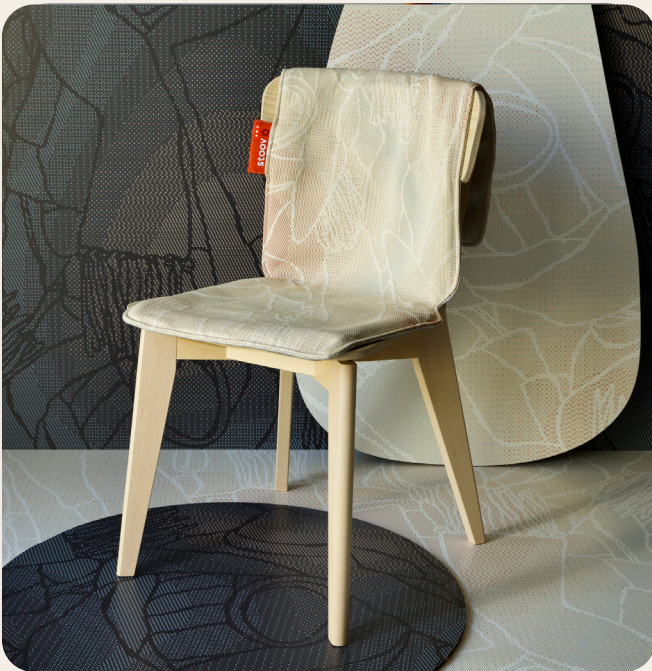
Big Hug Farben: Fragment Blau & Fragment Beige Maße // Preis: € 129,95