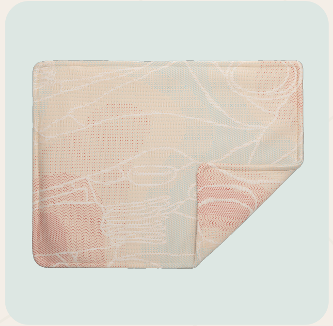
PLOOV Kissenbezug 45x60 Farben: Fragment Blau & Fragment Beige Maße // Preis: € 59,95