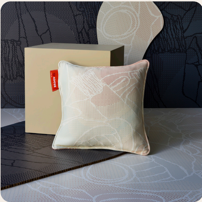
PLOOV Wärmekissen 45x45 Farben: Fragment Blau & Fragment Beige Maße // Preis: € 129,95