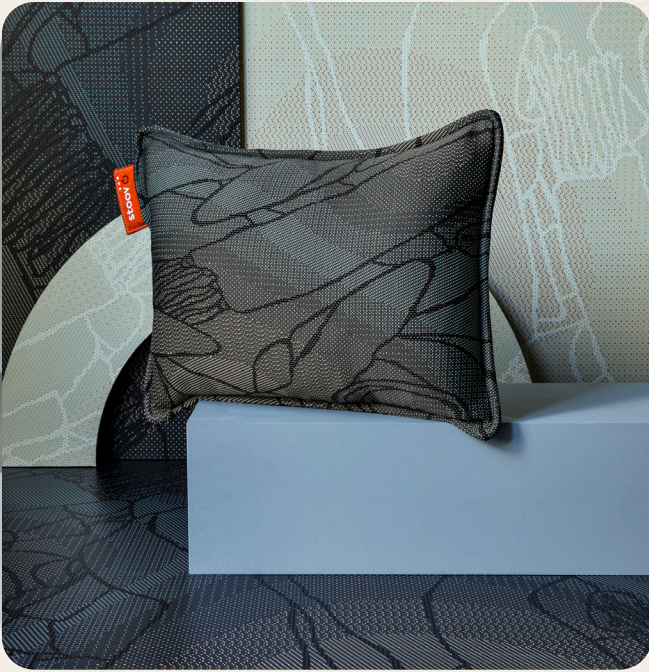
PLOOV Wärmekissen 45x60 Farben: Fragment Blau & Fragment Beige Maße // Preis: € 149,95