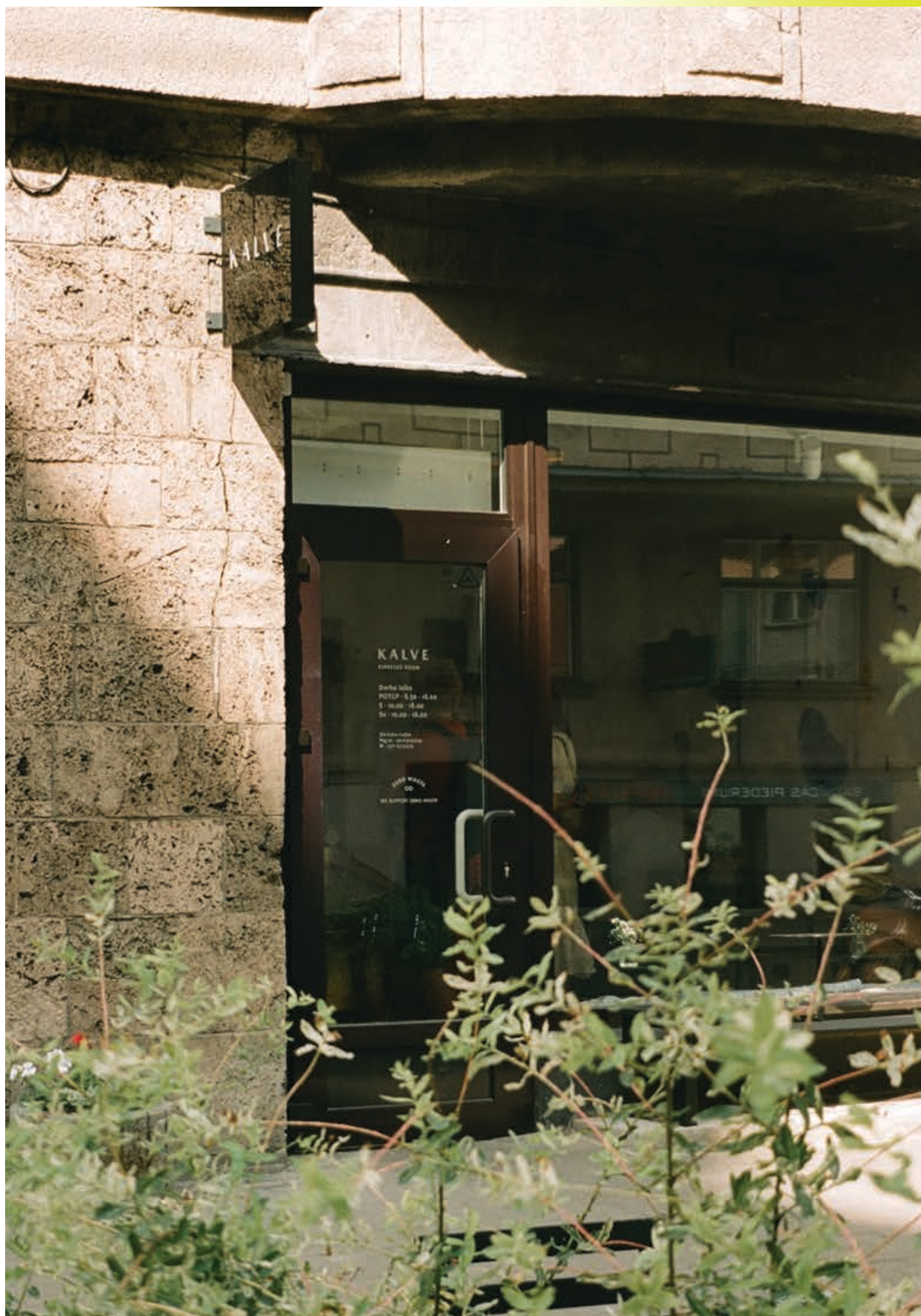
KALVE Espresso Room Nr. 2 Baznīcas 13, Rīga