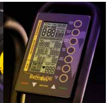
Verschillende intervalprogramma's Weergave van tijd, afstand, hartslag, tpm, watt, calorieën en snelheid.