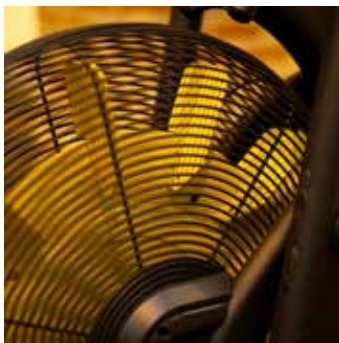
Duurzame, stalen ventilatorbladen die zijn bestand tegen intensieve trainingen.

Een frisse bries veroorzaakt door het ventilatorwiel tijdens het fietsen, zorgt ervoor dat de gebruiker lekker afkoelt tijdens de training.