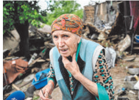
An elderly woman stands outside her heavily damaged house after it was hit by a missile in region of Donbass

Ukrainian lawmakers stood to applaud Polish President Andrzej Duda, who thanked them for the honour of speaking in a place where "the heart of a free, independent and democratic Ukraine beats", according to remarks carried by the Polish state-run news agency PAP. Duda's visit, his second to Ukraine's capital since April, came as Russian and Ukrainian