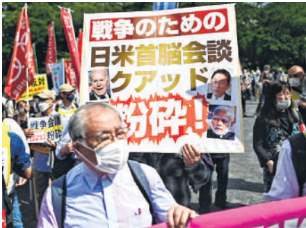
An activist holds a placard reading "crushing the Quad war summit" referring to the Quad summit during a protest against US President Joe Biden's visit to Japan, in Tokyo on Sunday

The formation of the Quad group took place to keep the strategic and significant sea routes in the Indo-Pacific region to be influence free while another main objective of the alliance is to offer financial help to nations with debt in the Indo-Pacific region, Financial Times reported.China has quite often criticised the security alliance as it sees it as a mechanism to contain its global