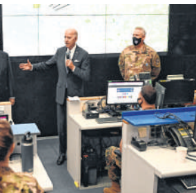
US President Joe Biden (2nd R), accompanied by South Korean President Yoon Suk-yeol (2nd L), speaks at Osan Air Base in Pyeongtaek on Sunday

At a time of high inflation and simmering dissatisfaction at home, Biden emphasized his global mission to strengthen the American economy by convincing foreign companies like Hyundai to launch new operations in the United