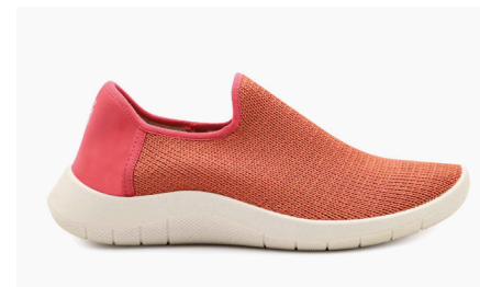
GAIA 1741 Brick Damen € 89.95 | Größen 35 - 42