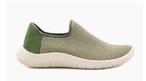
GAIA 1741 Green Damen € 89.95 | Größen 35 - 42 Herren € 99.95 | Größen 43 - 46