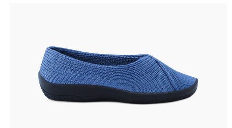
MAILU Sport 1711 Denim Damen € 59.95 | Größen 36 - 42