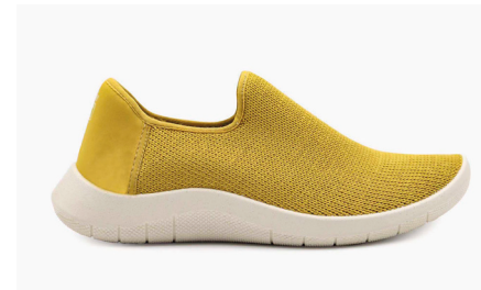
GAIA 1741 Mustard Damen € 89.95 | Größen 35 - 42 Herren € 99.95 | Größen 43 - 46