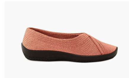
MAILU Sport 1711 Brick Damen € 59.95 | Größen 36 - 42