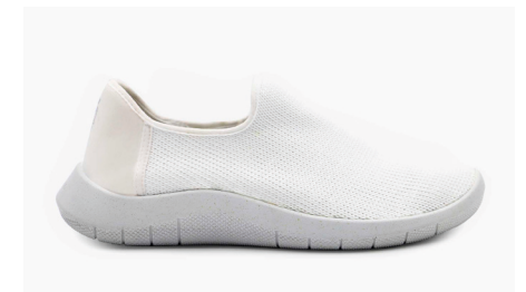
GAIA 1741 White Damen € 89.95 | Größen 35 - 42

Alle Modelle auch online erhältlich unter: www.strickschuhe.de Vorrätig auf Lager und sofort lieferbar!