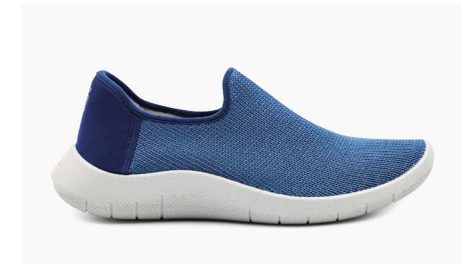
GAIA 1741 Blue Damen € 89.95 | Größen 35 - 42 Herren € 99.95 | Größen 43 - 46