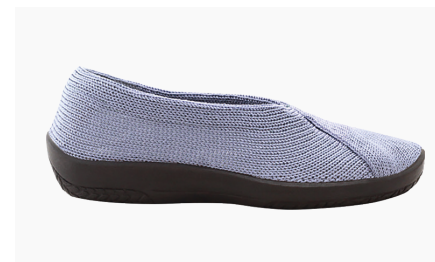
MAILU Sport 1711 Blue-Earth Damen € 59.95 | Größen 36 - 42