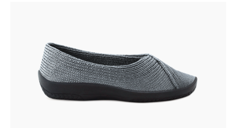
MAILU Sport 1711 Gun-Metal Damen € 59.95 | Größen 36 - 42