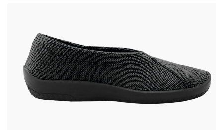
← MAILU Sport 1711 Black Damen € 59.95 Größen 35 - 43