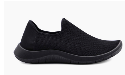
GAIA 1741 Black Damen € 89.95 | Größen 35 - 42 Herren € 99.95 | Größen 43 - 46