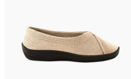
MAILU Sport 1711 Beige Damen € 59.95 | Größen 36 - 42