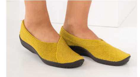
MAILU Sport 1711 Mustard Damen € 59.95 | Größen 36 - 42