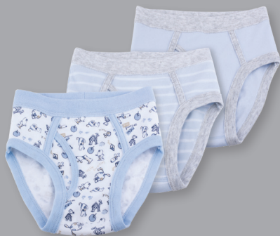
彩色全棉內褲3件裝*(2-6Y)