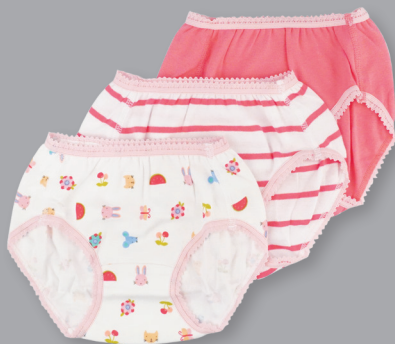
彩色全棉內褲3件裝*(2-6Y)