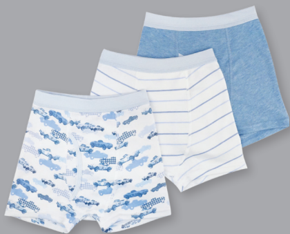
彩色平腳內褲3件裝*(2-6Y)