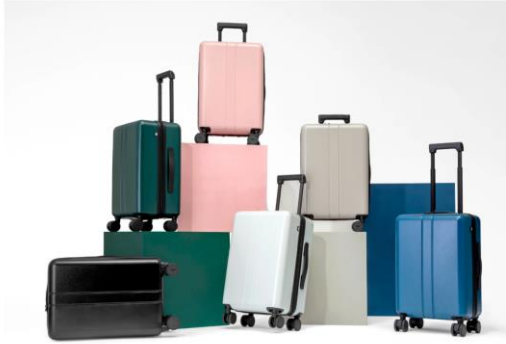
An Omotenashi Selection Gold Award winner, the Maimo Color You suitcases are each fitted with a USB port and extra-quiet replaceable wheels.