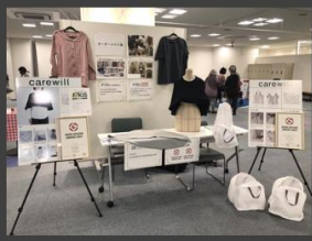
ATC エイジレス博 (大阪府 大阪市 ATC)