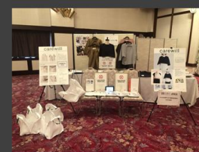
宮崎県作業療法学会 (宮崎県 宮崎市)