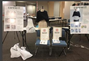
九州作業療法学会2023 (鹿児島県 鹿児島市)