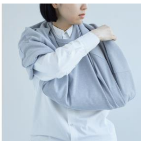
肩まわりを整える