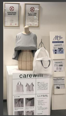
ATCエイジレスセンター (大阪府 大阪市 ATC)