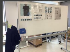
帝京平成大学 健康メディカル学部 (東京都 豊島区)