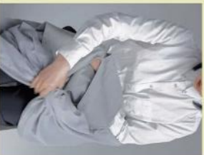
絡みている衣類の腕を袋状のスリングに通し、もう片方の手で握りをつかんでかぶる

これからも、ケアを必要とする人々を感じる不自由を解消する商品を作り出していきます。