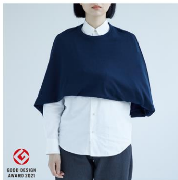
アームスリングケープ

「傷病や障害度数、病院や施設の中など、症状や場所を問わず、おしゃれて幅広く着られるような、患者さんの服の不自由を最大公約的に解決する製品をつくらうと思いました。脳卒中による片麻痺や骨折・脱臼患者向けに、一人でも片手で着脱が可能で、腕を保持する腕帯が目立たない、三角巾とケープが一体化したアームスリングケープの開発をスタートさせました」（菟沼氏）