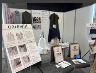
Tokyo Startup Gateway2023 (東京都 千代田区 東京国際フォーラム)