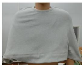
アームスリングケープ

2021年11月の販売開始以降、ケアウィルの製品を購入したお客さまからは、“温かく感じる”との意見が多数寄せられていました。本研究は、なぜケアウィルのアームスリングケープを温かく感じるのか、その根拠を明確にすることを目的に始まりました。臨床（医療の現場）における被験者実験による評価、サーマルマネキンによる温熱特性評価により、患者のQOL向上を目指すとともに、次期モデルの開発のための最適なデザインを探る取り組みです。