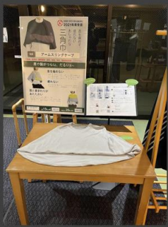
(医)真正会 霞が関南病院 (埼玉県 川越市)