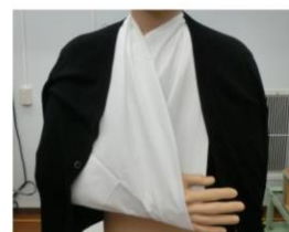
三角巾+カーディガン