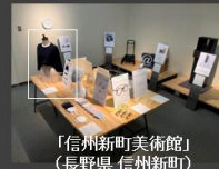
「信州新町美術館」 (長野県 信州新町)