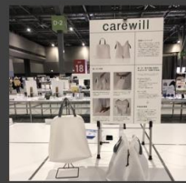
グッドデザイン賞審査 (愛知県 国際展示場)