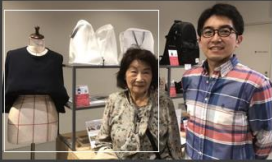
台湾『誠品生活』 (東京都 中央区 コレド室町)