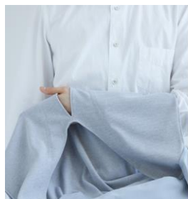
内側にある袋に患側の腕を通す