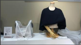
グッドデザインストア (東京都 豊島区 池袋東武百貨店)