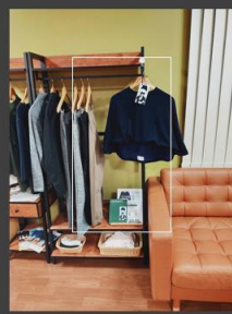
(医)健育会 湘南慶育病院 (神奈川県 藤沢市)