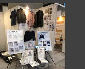
メディカル台湾 /Medical Taiwan 2023 (台北市 台北南港第二展示ホール)