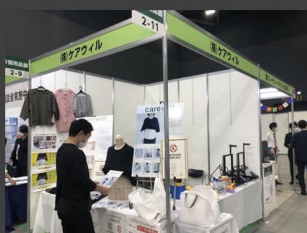
CareTex福岡2022 (福岡県 福岡市 マリンメッセ福岡)