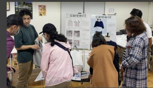
脳卒中フェスティバル (東京都 墨田区)