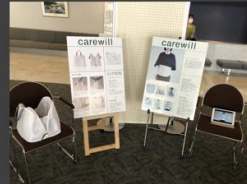
宮崎保健福祉専門学校 (宮崎県 清武町)