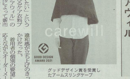
グッドデザイン賞を受賞したアームスリングケープ

「君たい、選たい、着たい」という思いに込められたケア衣料のブランド「ケアウェア」の開発と販売によって新市場開拓を目指している。設立は2019年。発起人代表が、妻友を介して経験を通じて、入院者や患者さんといった画一的な衣類に対して考えた