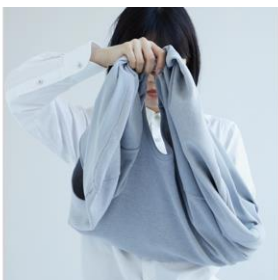
襟ぐりをつかんで首に通す