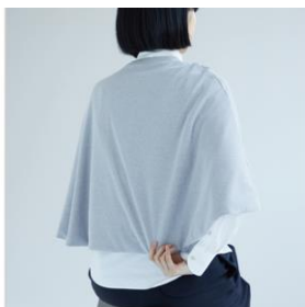
後ろ身ごろを整える