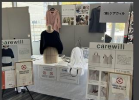
かわさき基準認証福祉製品2022 授与式 (神奈川県 川崎市)