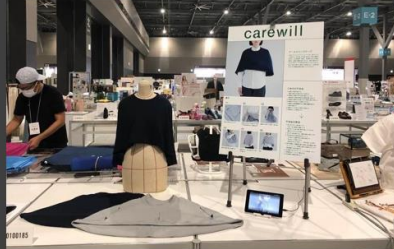
グッドデザイン賞審査 (愛知県 愛知国際展示場)