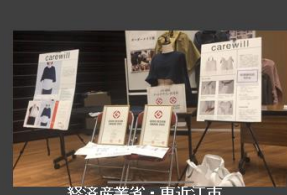
経済産業省・東近江市 高齢者関連製品安全公演イベント (滋賀県 東近江市)