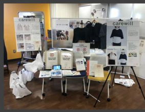
湘南慶育病院 慶育祭 (香川県 藤沢市)