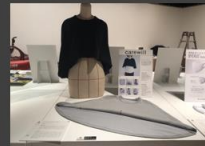
(公社)日本インダストリアル デザイン協会 受賞展示 (東京都 港区 AXIS)