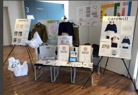
田園調布学園大学 (東京都 杉並区)