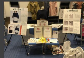
崎KIS認証製品体験展示会 (神奈川県 川崎市)