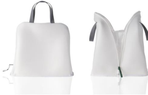
Designed by Daisuke Kaneda and Ken Okamoto Design Office for Carewill Inc., the Laundry-net Bag can be zipped up full of clothing and tossed into a washing machine as is.

Though not specifically designed as a travel product, the Carewill Laundry-net Bag is just as useful on a trip as it is at home. A winner of the Omotenashi Selection Special Distinction ANA Award, it's also a good example of effective universal design.