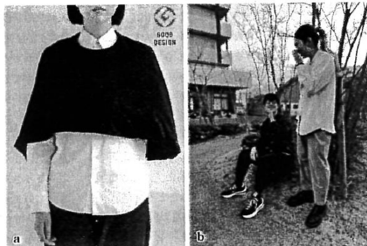
図 インクルーシブ、アダプティブデザインを体現したプロダクト a: ケアウィル社のアームスリングケープ。アームスリングとケープが一体化しており、亜脱臼を有する麻痺手や骨折した上肢の重みを服の生地全体で支えるようにデザインされている。b: SOLIT 社のシャツ。腕の動きを邪魔しないラグランスリーブや片手でも操作しやすいマグネットボタン、袖ボタンを有さないゴムによる袖口等がデザインされている。両プロダクト共に、デザインの方で、障がいと共に生きる方も一般の方も同等におしゃれを楽しめるインクルーシブかつアダプティブなデザインを体現している

世界の潮流の中でも、この変化は明らかで、アダプティブウェアのブランド「RESET」の創始者である Monika Dugar は、自身の父の介護の体験から、本人と家族にとって、「衣服のちょっとした変化が人生を大きく変える」と述べている 1) 。デザイン性と機能性の双方を有した衣服で、障がいと共に生きる方々のニーズに応えるだけでなく、それらのデザインが、一時的なトレンドで終わることな