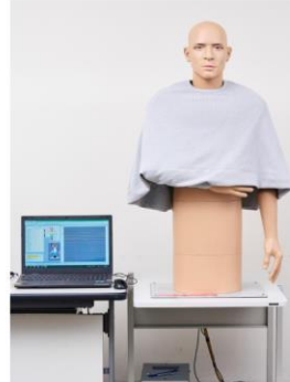
サーマルマネキン「Sumio」

「動作安定性の検証では、墨田支所の衣服圧測定装置を活用しました。衣服圧測定装置は、靴下やストッキングの足首周りやふくらはぎ周りの圧力を測る装置ですが、今回はその装置を応用して、人体側に係る圧力を測定しました。結果として、結果として、首の部分への圧力が最も高く、三角巾の結び目の痛さを再現するデータが得られました」（山田）