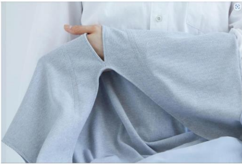
FASHION | JAPAN LIFE | TW COLLAGE

Practical Products For Those With Arm Injuries BY WEEKENDER EDITOR