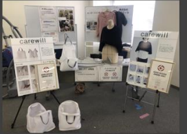
東京都 福祉用具・新製品展示会 (東京都 新宿区)