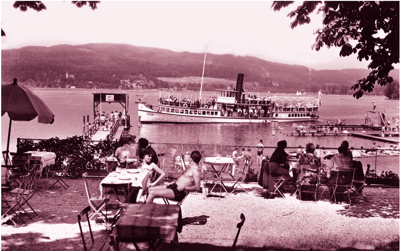
Der Gastgarten vom Restaurant war um 1950 nur halb besetzt, als das Dampfschiff „Thalia“ um 14 Uhr die Schiffsstation Maiernigg erreicht hat.