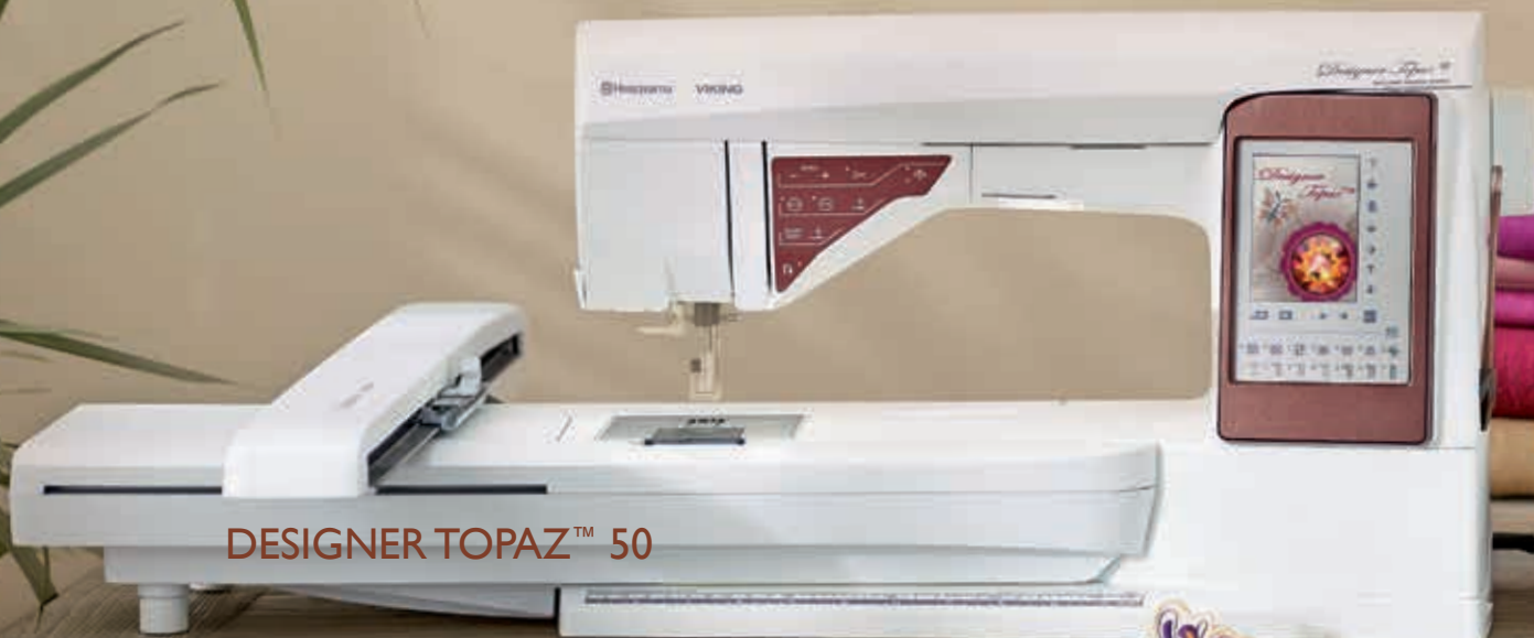
DESIGNER TOPAZ™ 50