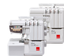
eXtend 664PRO & 664 Surjeteuses à 3/4 ou 2/3/4 fils (PRO) avec réglage facilité.