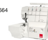
eXtend 864air Surjeteuse à 2/3/4 fils avec enfilage à air des boucleurs et enfile-aiguille intégré.