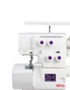
eXtend 264 Surjeteuse à 3/4 fils compacte et essentielle.

Une garantie de 5 ans est automatiquement incluse avec nos produits destinés à un usage domestique et démontre bien que nous croyons indéniablement en leur longévité.