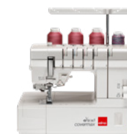
eXtend covermax Recouvreuse à 2/3/4/5 fils avec en plus un point cover double-face à l'aide d'un mécanisme intégré.