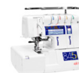
eXtend 845 Surjeteuse / recouvreuse combinée à 2/3/4/5 fils avec point de recouvrement et contrôle automatique de la tension.