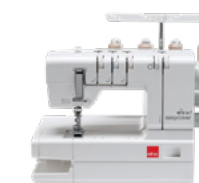
eXtend easycover Recouvreuse à 2/3/4 fils pour réaliser des ourlets couverts et des points chaînette.