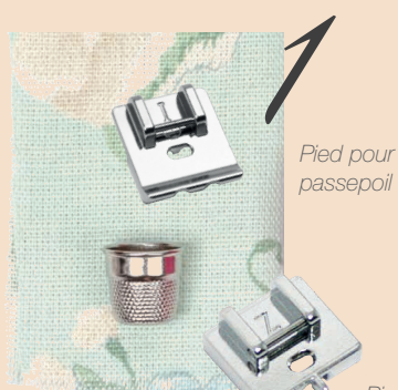
Pied pour passepoil