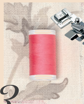
Pied pour pose de biais