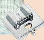
Pied pour pose de fermeture éclair invisible