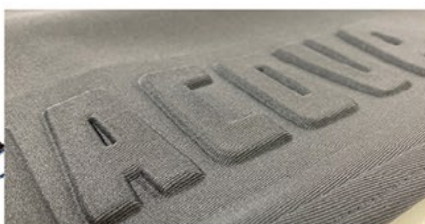
SINAVOVAロゴをエンボス加工 ※この画像は加工が分かりやすいように実物よりも明るく撮影しています。