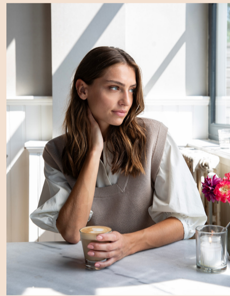
Blouse: €69,95, spencer: €59,95.

Located in the former police station of Alkmaar, you will discover Stadscaffee Laurens. In this beautifully decorated building, they serve simple and elegant dishes prepared with a lot of love and attention.