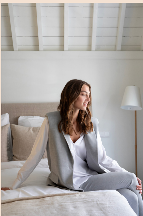
Sleeveless blazer: €139,95, trousers: €109,95, top: €79,95.

On top of Restaurant 't Fnidsen, you will find a boutique hotel with a lot of the old character of the building still intact. Choose one of the rooms and wake up with the historic center of Alkmaar as a view.