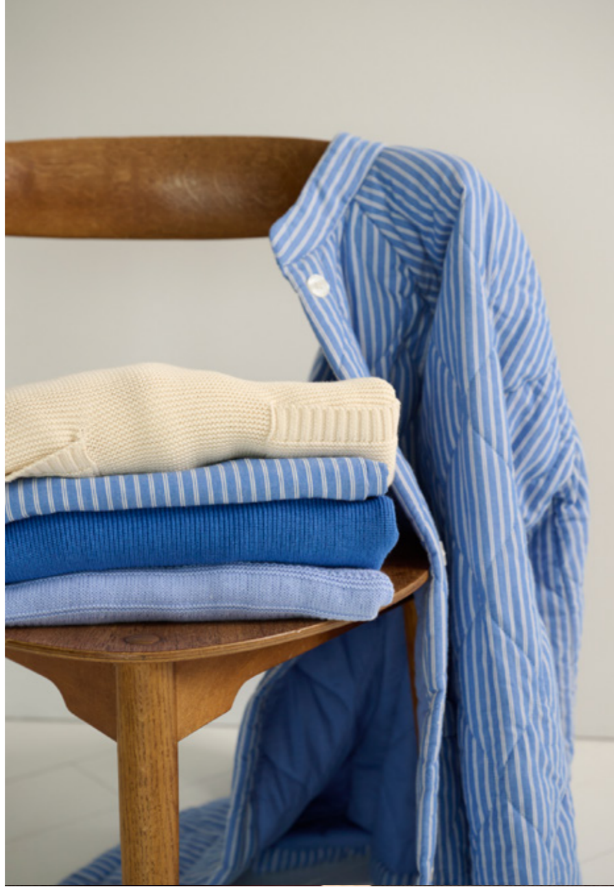
EARTH SWEAT - MOON PANTS STRIPE