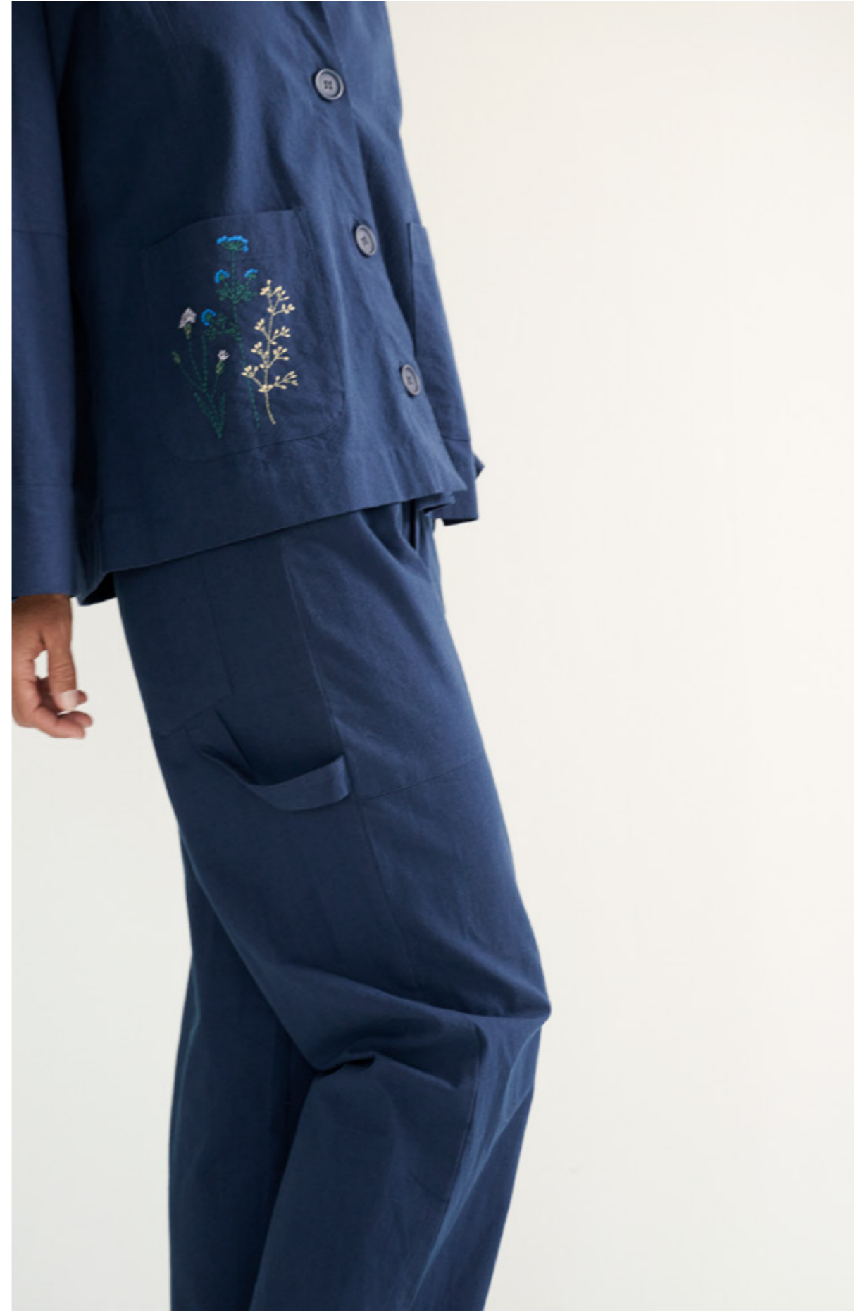
BLOOM JACKET CREPE - EVERLY PANTS CREPE