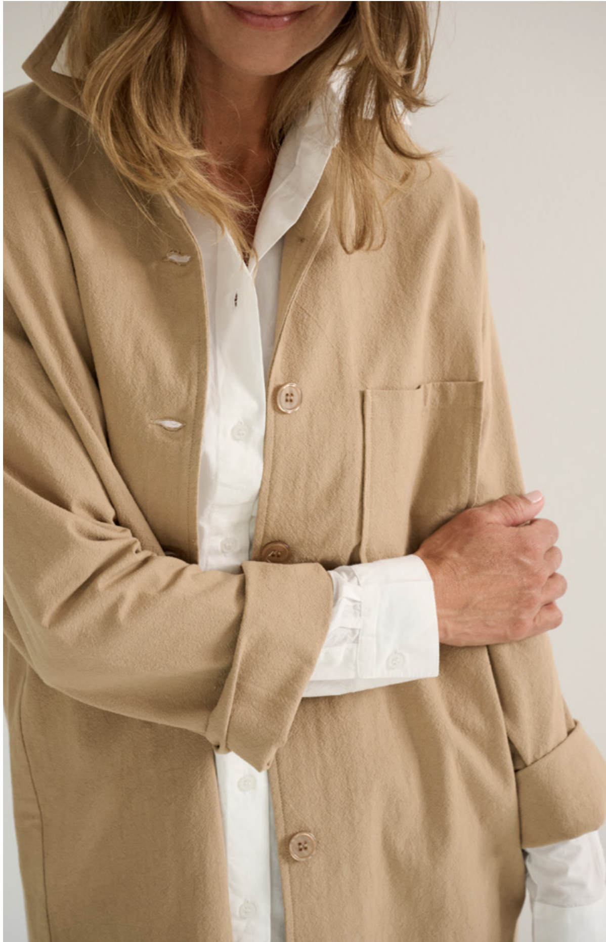
GAIA SHIRT - HIGHER SHIRT CREPE - LOWER PANTS CREPE