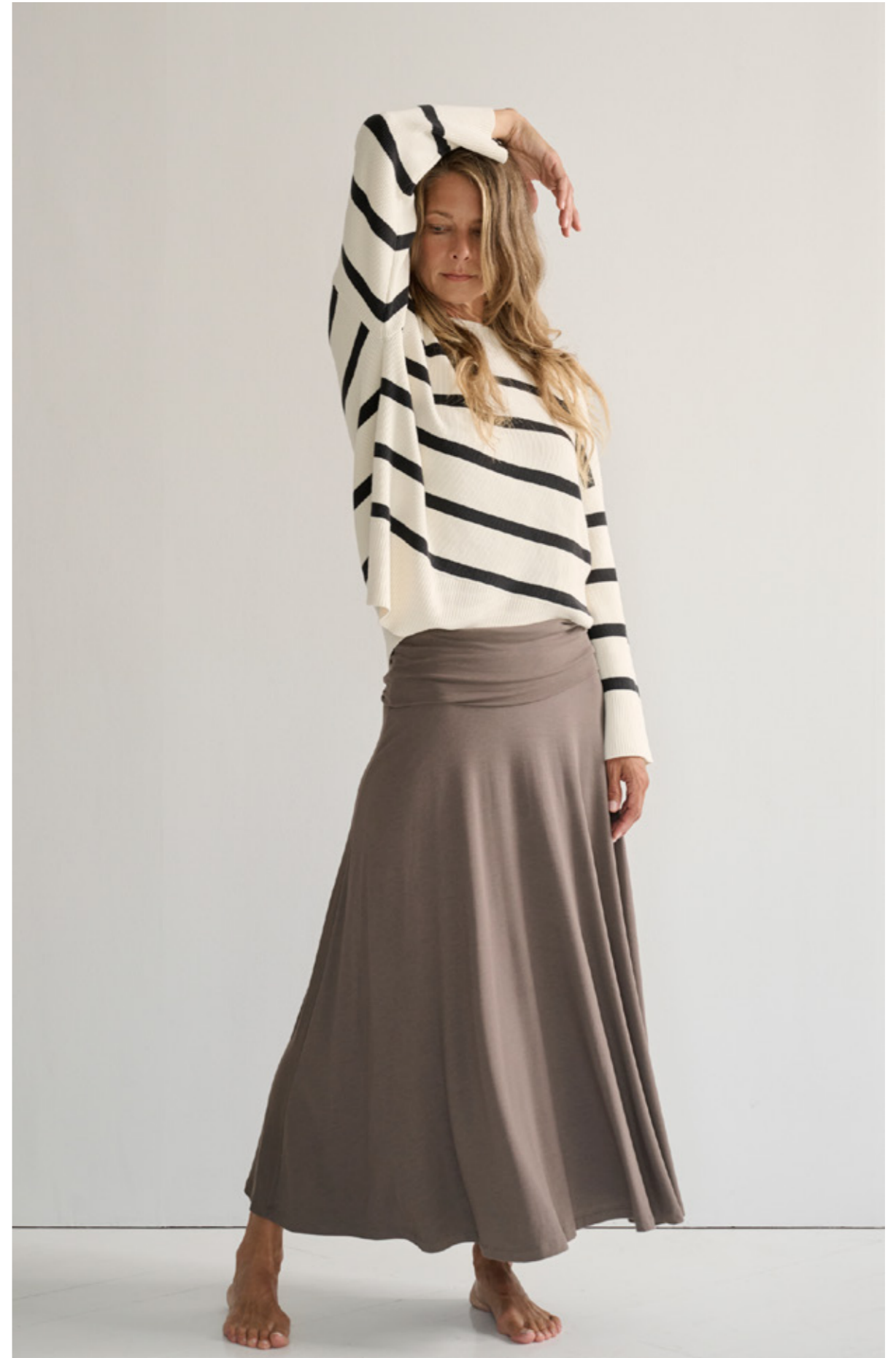
DEARLY RIB KNIT STRIPE - GRACIOUS SKIRT