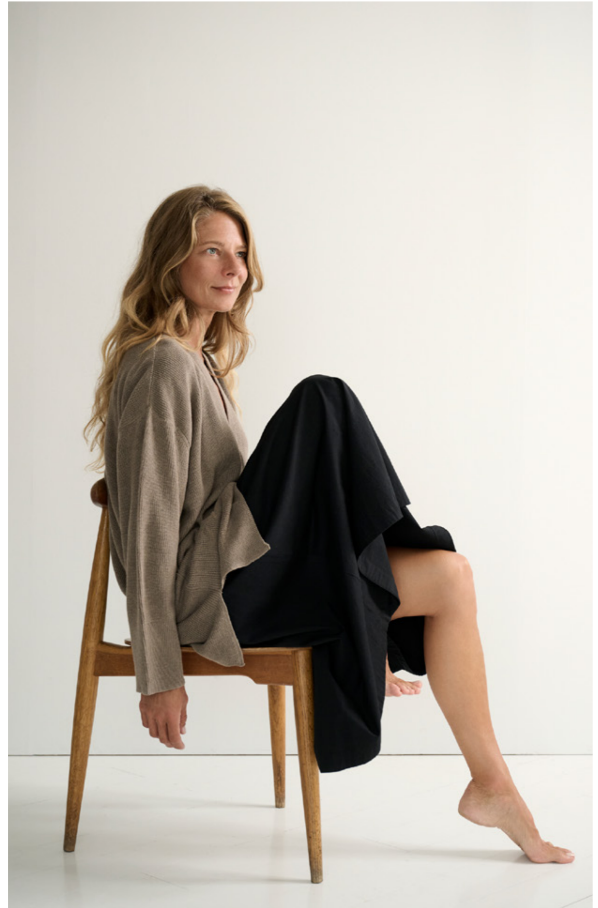
JENKA RIB KNIT CARDIGAN - POEM SKIRT TWILL