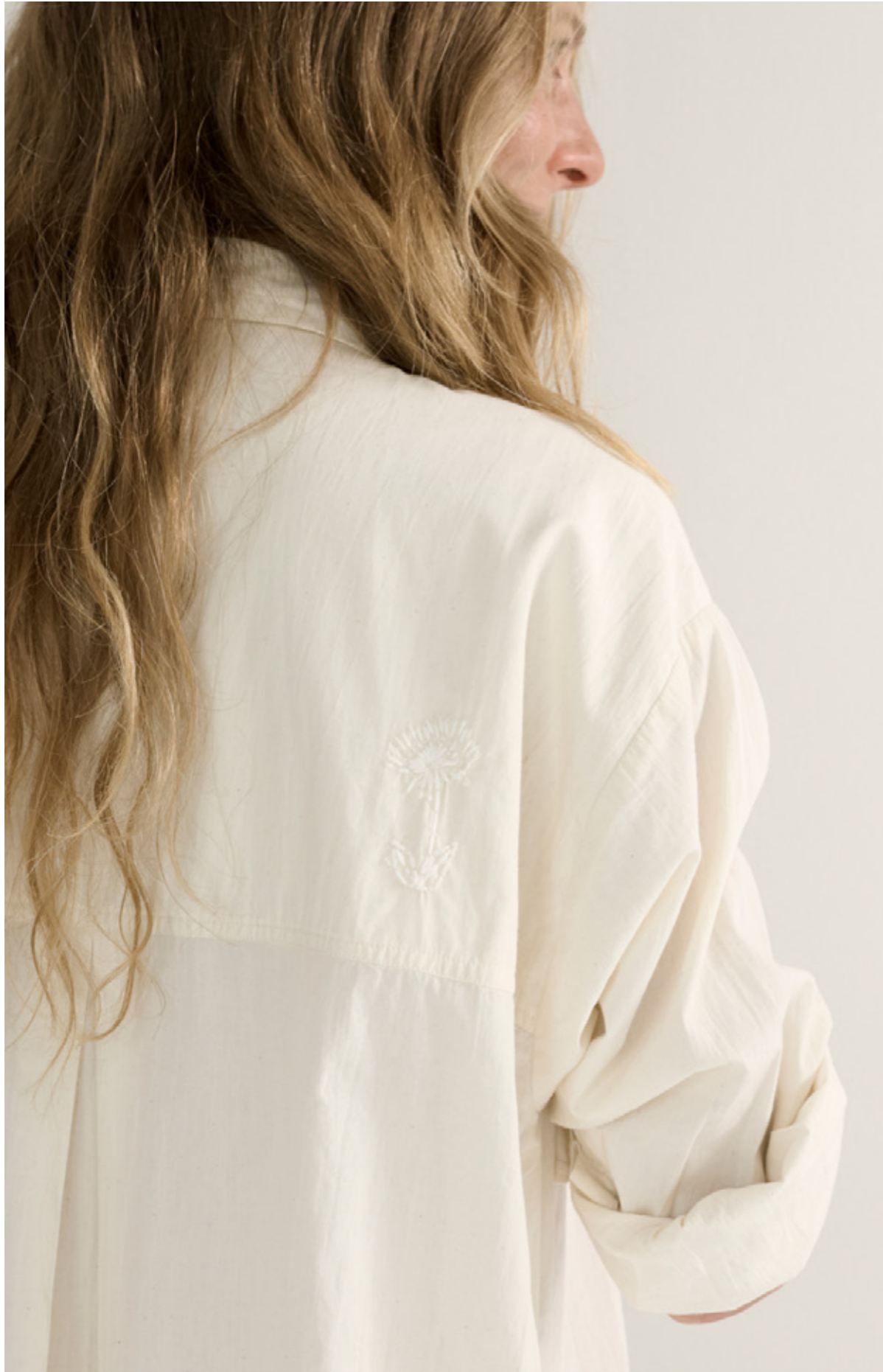
FLORET SHIRTDRESS POPLIN