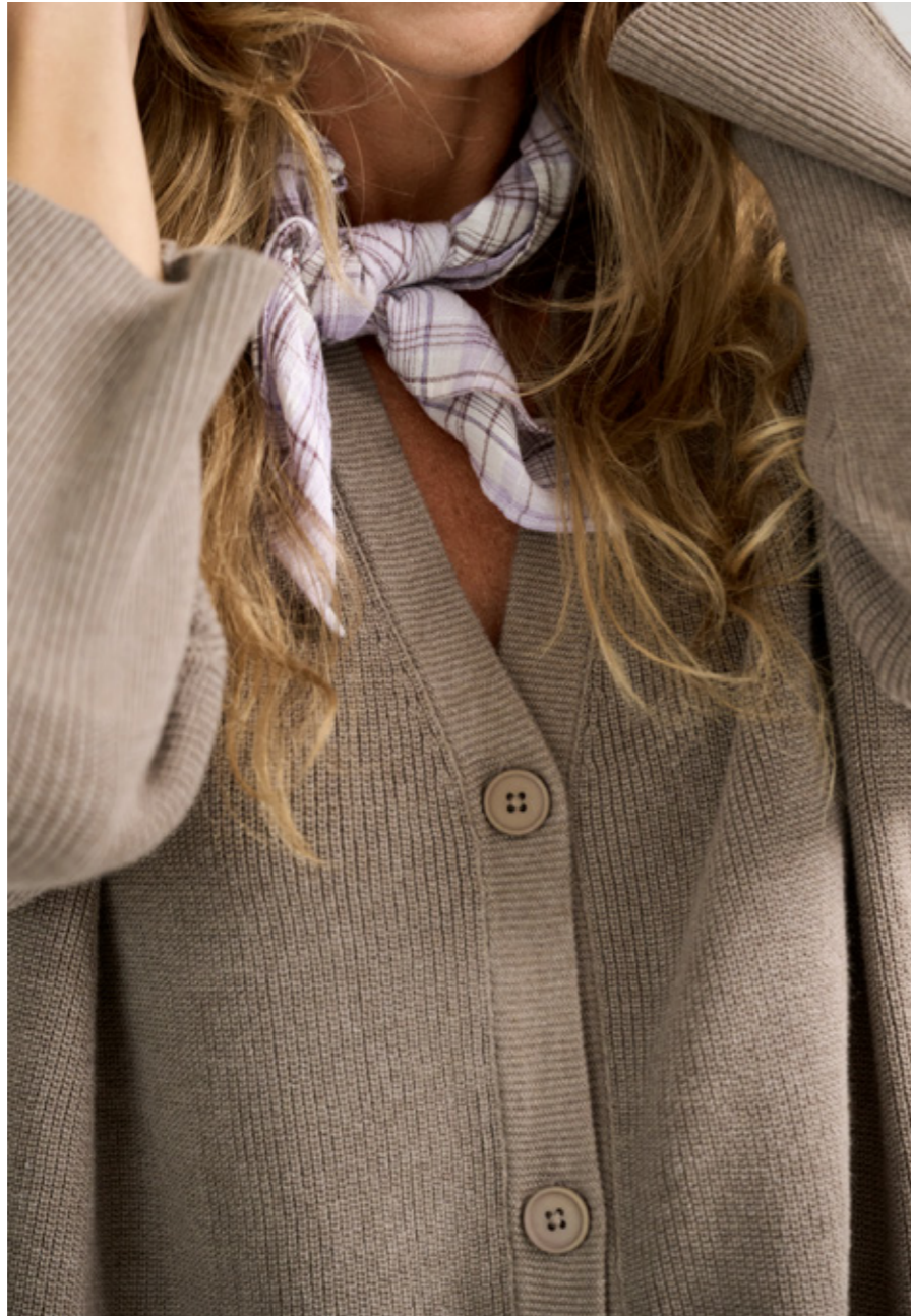
JENKA RIB KNIT CARDIGAN - ESSENTIAL SCARF CHECK