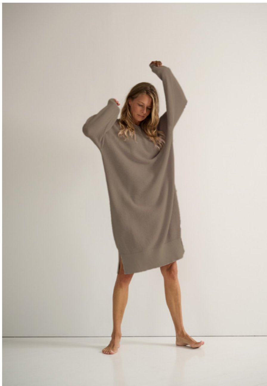
ZONA RIB KNIT DRESS