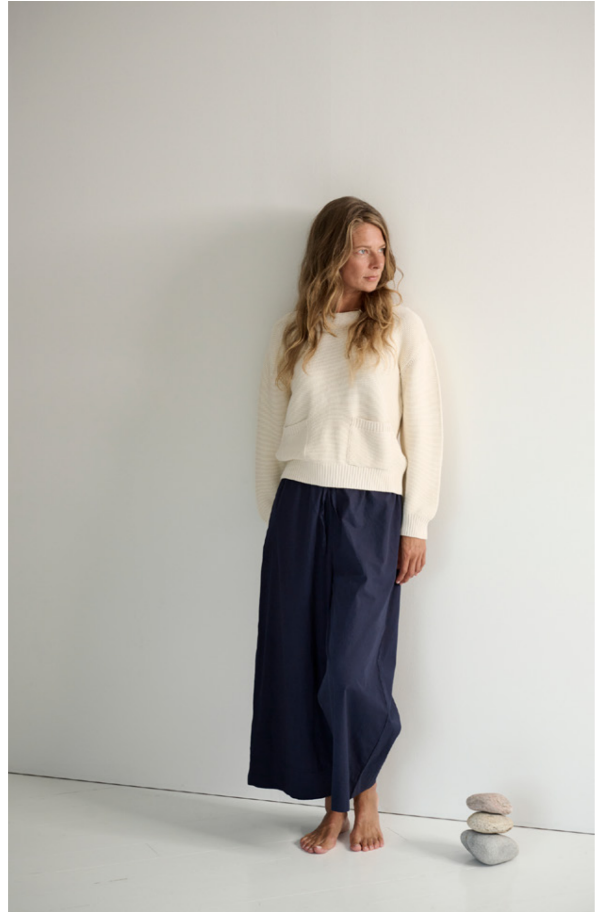
SERENA KNIT - STORY PANTS POPLIN