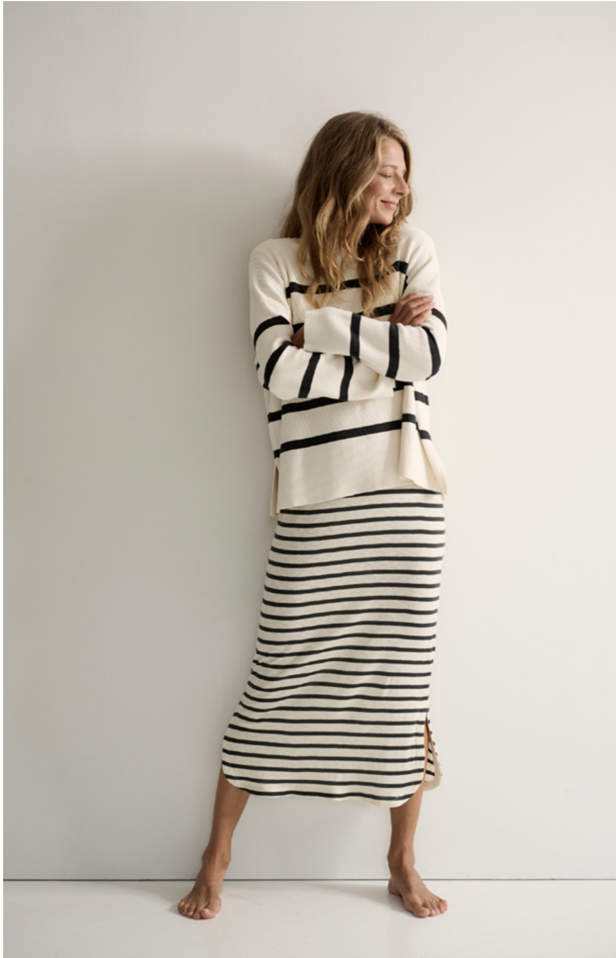
DEARLY RIB KNIT - CHARISMA DRESS STRIPE