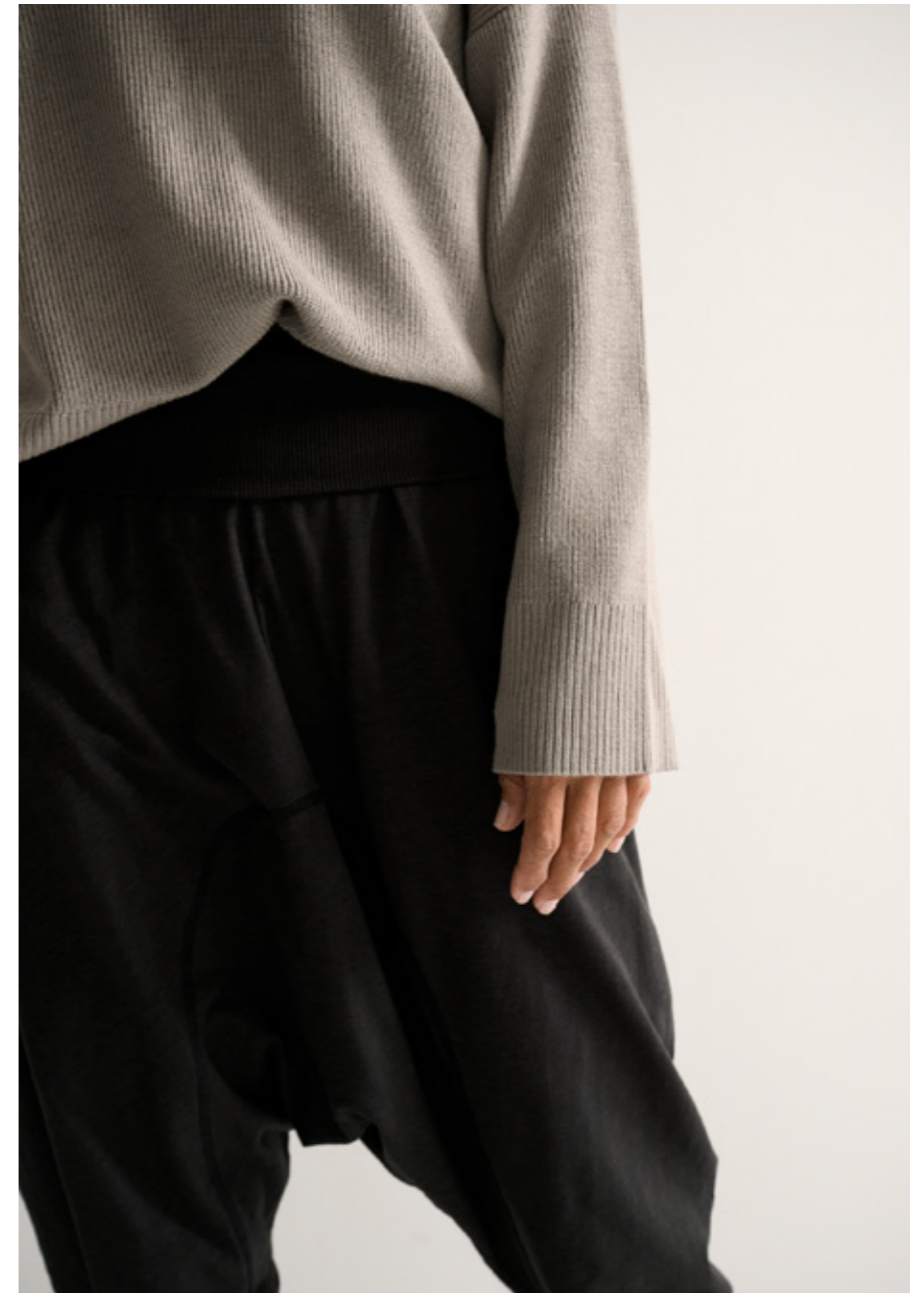
DEARLY RIB KNIT - SAVASANA PANTS