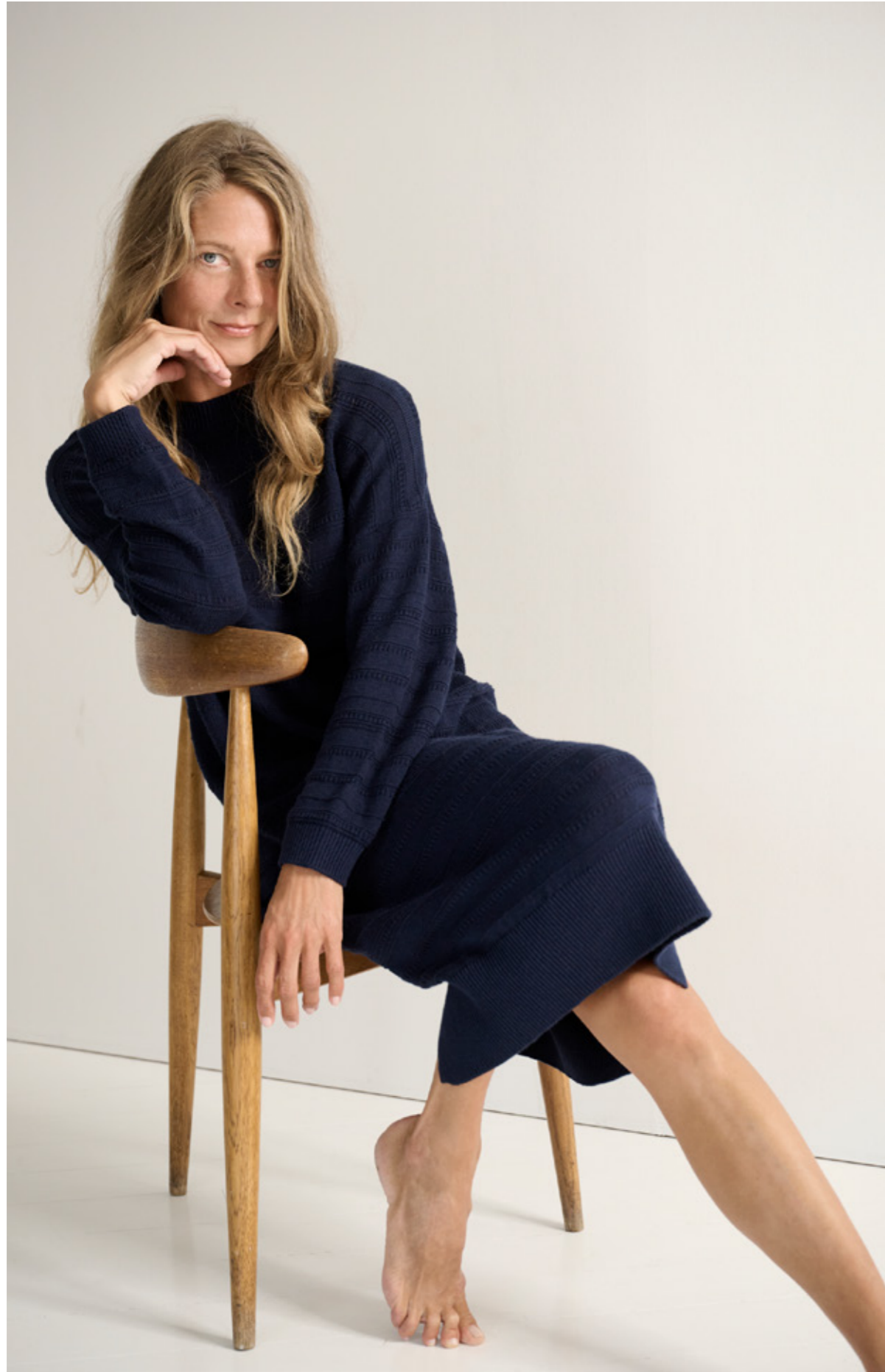
HAZEL KNIT DRESS