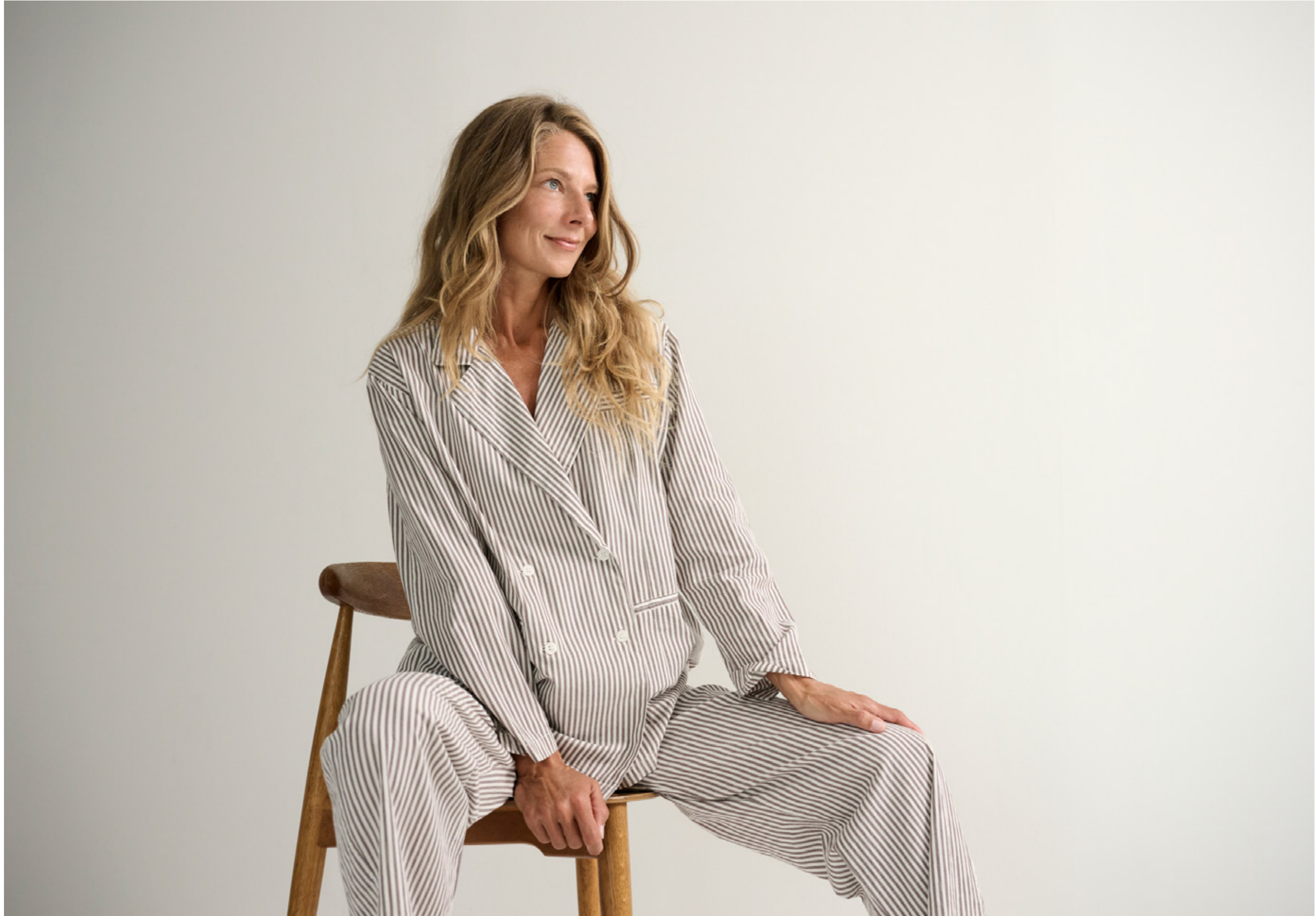
VIVA SHIRT STRIPE - MOON PANTS STRIPE