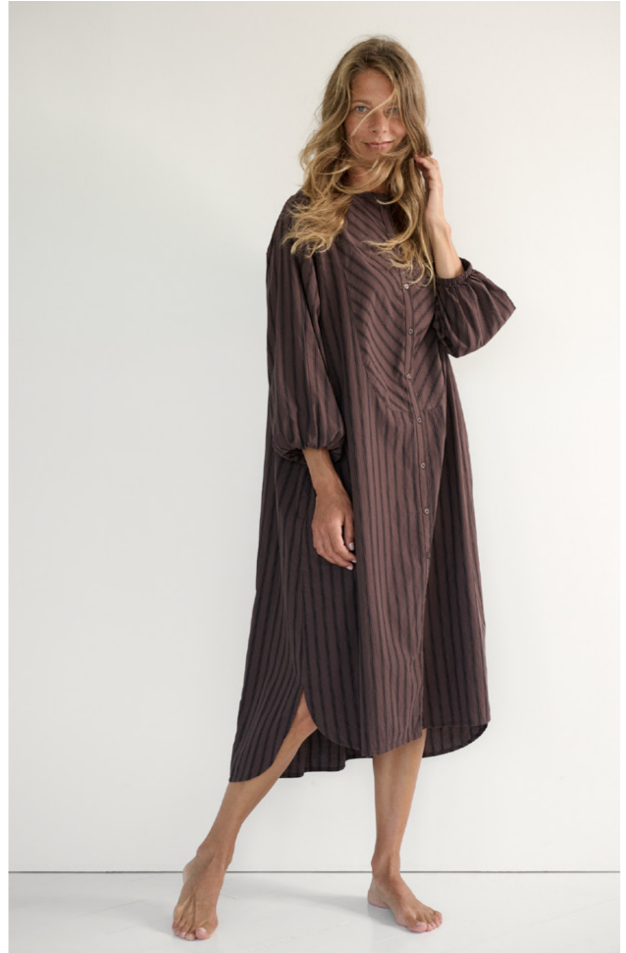
LAUREN SHIRTDRESS STRIPE