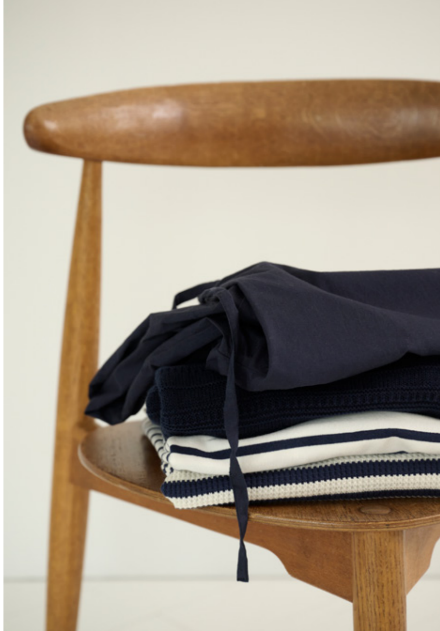
HAZEL KNOT DRESS