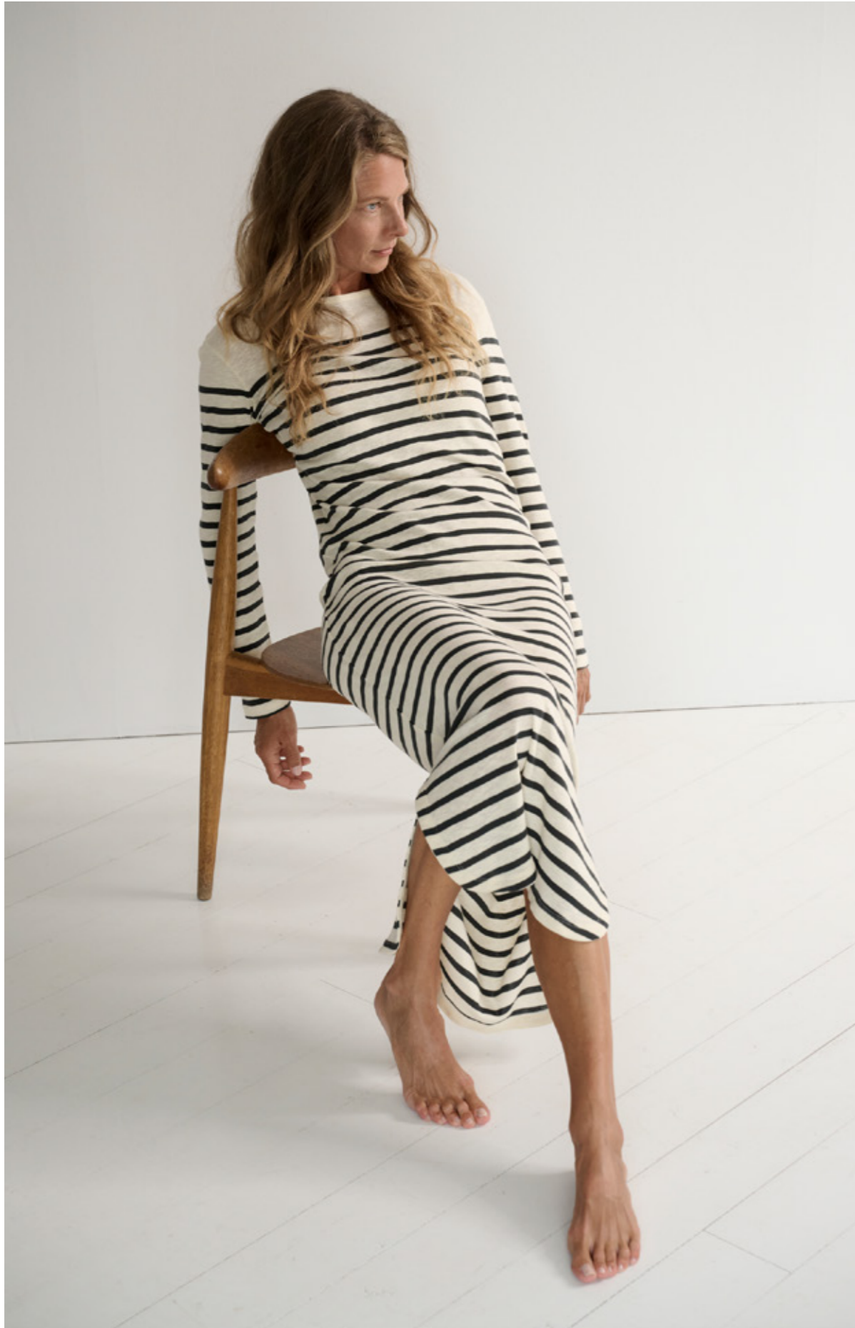
CHARISMA DRESS STRIPE