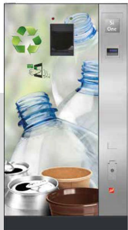
Die SiOne-Serie von Sielaff bestehend aus SiOne Small und SiOne.