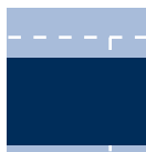
Image size: 300 × 300 pixels (lower third in image without text)

Text: max. 50 characters (including blanks) Optional roof line (max. 30 characters incl. blanks)