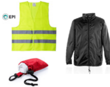
Prendas Textiles Garments