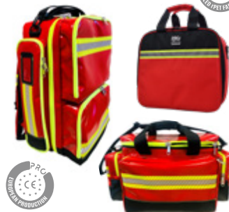
Botiquines First Aid Kits