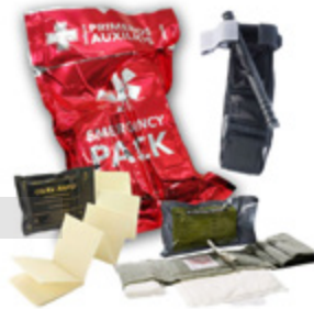
Kits Hemostáticos Hemostatic Kits