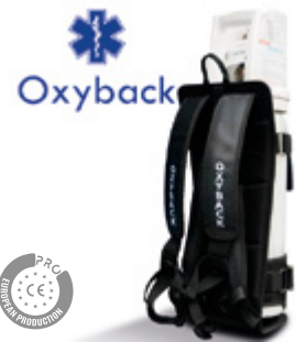
Oxigenoterapia Oxygen Therapy