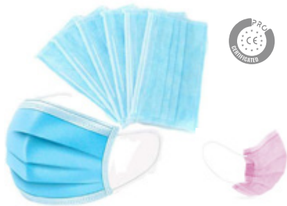
Mascarillas Quirúrgicas Surgical Masks