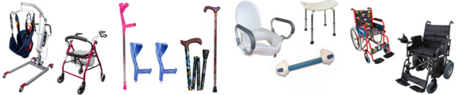
Ayudas a la movilidad Aid for mobility