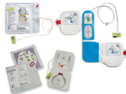
Parches de Desfibrilación Defibrillation Patches