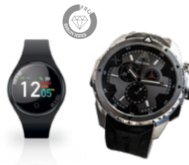
Relojes & Smartwatches Accessories