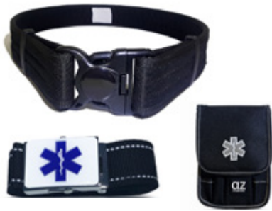
Complementos Profesionales Professional Equipment