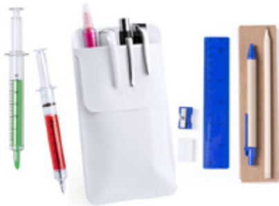
Papelería y Oficina Stationery