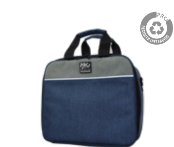
Asistencia Sanitaria Home Care