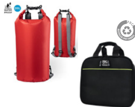
Bolsas y Mochilas Bags & Backpacks