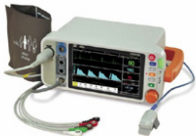
Monitores Display Units