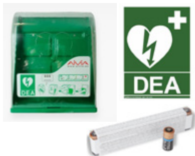
Señalética y Accesorios Signaling and Accesories