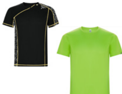
Ropa Técnica Technical Clothing