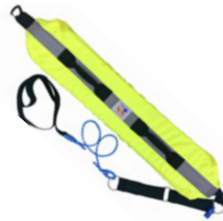
Rescate Acuático Aquatic Rescue