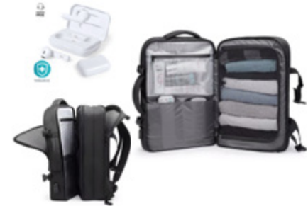
Viajes y Electrónica Travel & Electronics