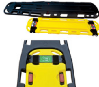
Traslado de víctimas Victims' trasfer