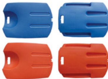
Tablas de RCP CPR Charts