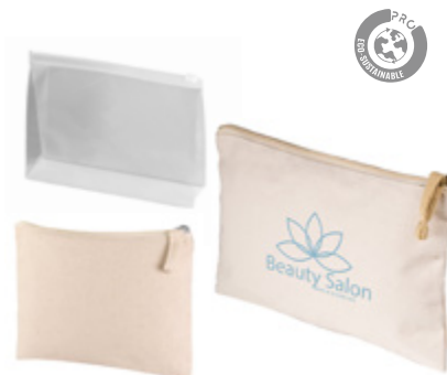
Kits de Higiene Hygiene Kits