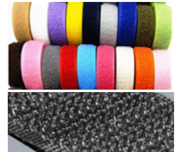
Sistemas de Sujeción Hook & Loop