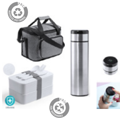
Para Llevar Contigo To Carry