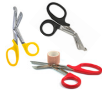
Instrumental Emergency materials