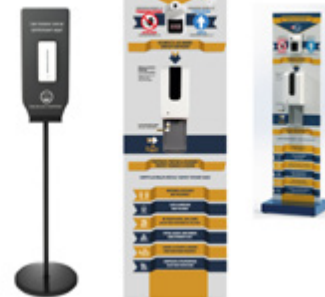
Dispositivos Automáticos Automatic Devices