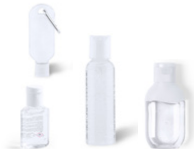
Geles Hidroalcohólicos Hydrogel