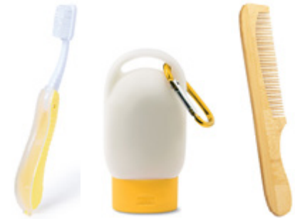
Higiene Personal Personal Hygiene