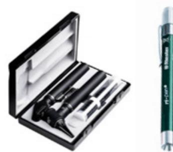
Otoftalmoscopia e Iluminación Ophthalmoscopy and lighting