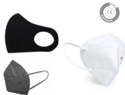
Macarillas EPI's PPE Masks