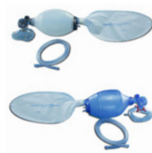
Resucitadores Manuales Manual Resuscitators