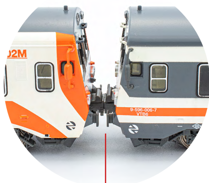
Enganches Scharfenberg funcionales con posibilidad de acoplar varias unidades

Todos estos detalles y acabados demuestran que el modelo HOBBY no tiene por que ser sinónimo de baja calidad o falta de detalles, en su lugar esta nueva gama quiere acercar el hobby ferroviario a los modelistas y coleccionistas.