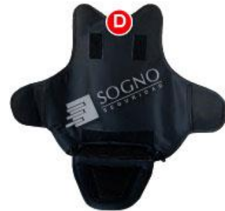
PROTECTOR GENITALES Y PECHO