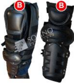
PROTECTOR BRAZO, CODO, ANTEBRAZO