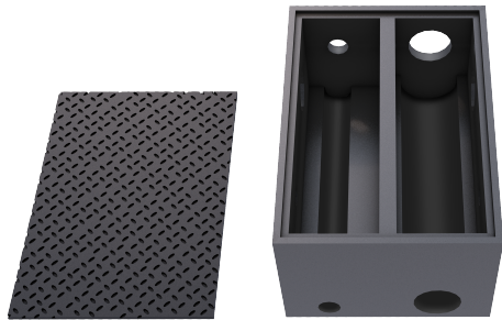
Registro para separación de aguas