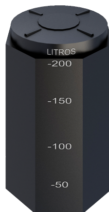
Registro de lodos