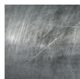
Acero lacado (acero en bruto)

Terminación: laca protectora brillante RAL: LAC